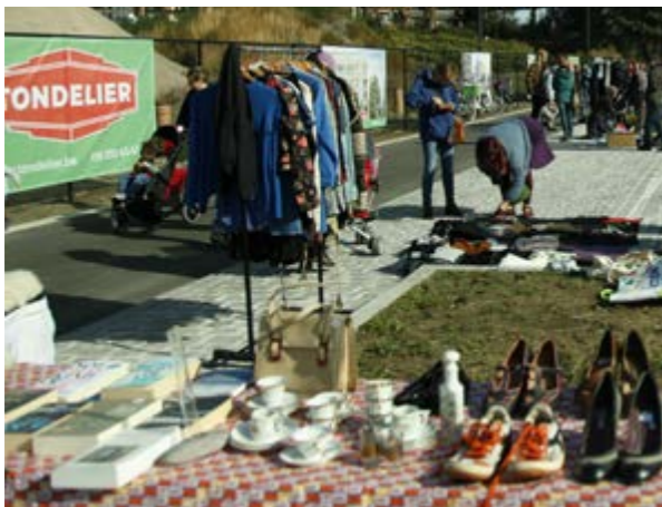
Blaisantfestival: rommelmarkt, kindersanimatie

De eerste bewoners zijn er al. Binnenkort opent een restaurant en over enkele maanden de buurtsporthal. Tegelijk breidt de wijk uit aan het andere uiteinde van de pas aangelegde Tondelierlaan. De nieuwe laan werd ingewijd met een rommelmarkt tijdens het Blaisantfestival. Vanaf nu kunnen wandelaars en fietsers de weg gebruiken als snelle en veilige doorsteek van noord naar zuid doorheen de nieuwe woonwijk.