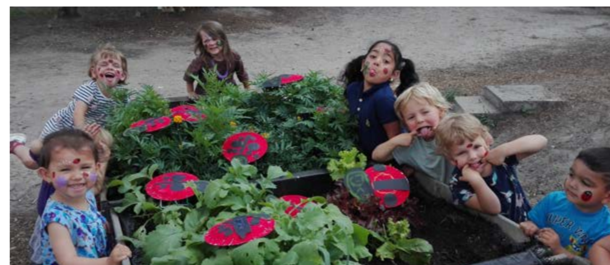
Binnenplein Maria Goretti 2018