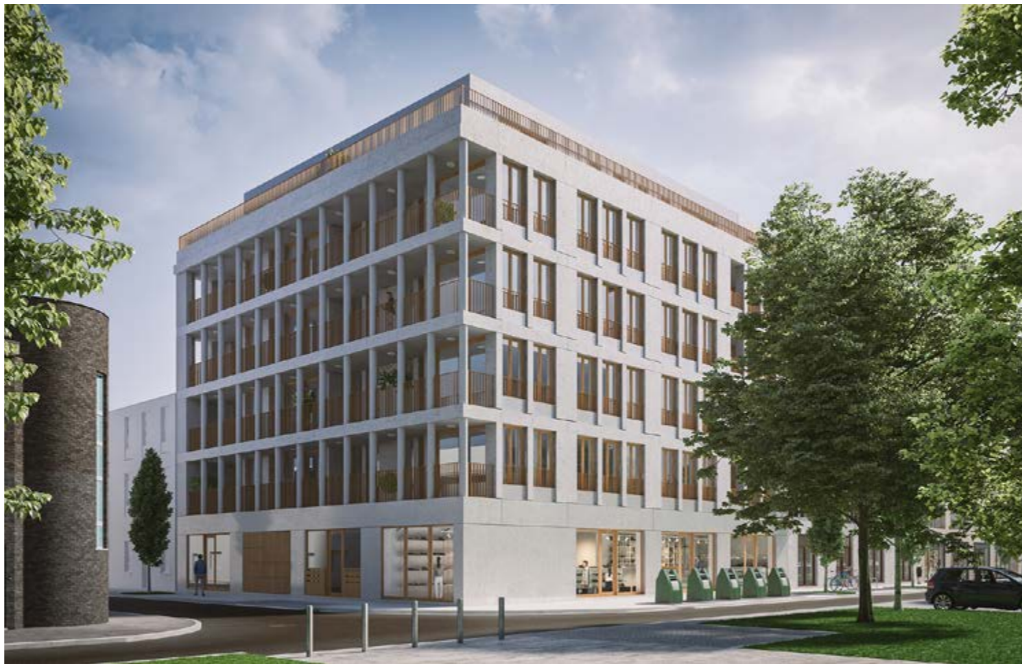
Nieuwe gebouwen langs Filips van Cleeflaan

In de eerste gebouwen 'Nieuwe Molens Gent' en 'Krono Gent' zijn al 70 appartementen verkocht, waaronder 20 budgetwoningen. In oktober start de verkoop van bouwfase 2. Op de hoek van de Muishondstraat en de Filips van Cleeflaan worden vanaf 2019 namelijk 48 appartementen gebouwd (zie foto). Daar zitten ook 15 budgetappartementen bij. Die zijn te koop met ruim 20 % korting op de marktprijs. Bent u kandidaat-koper en voldoet u aan de juiste criteria, dan moet u tijdens de inschrijfperiode (begin oktober tot half december) een dossier indienen. Met de budgettest op www.budgetwoningen.gent weet u of u in aanmerking komt.