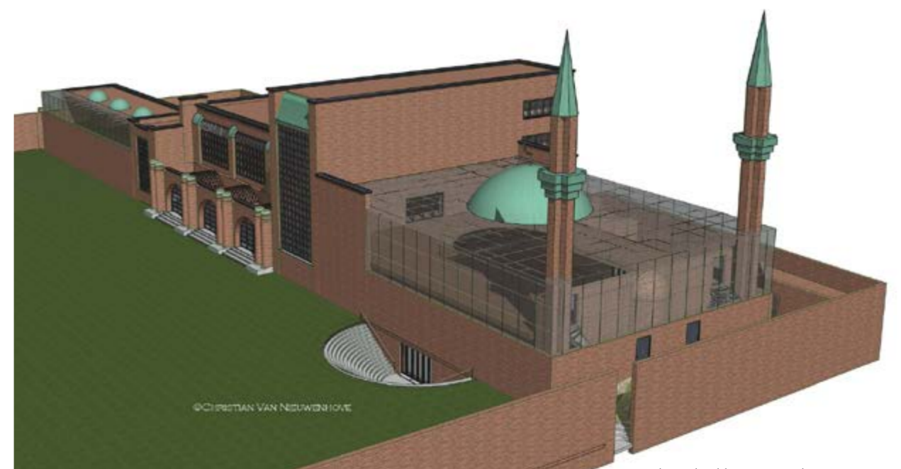
Toekomstbeeld groene moskee