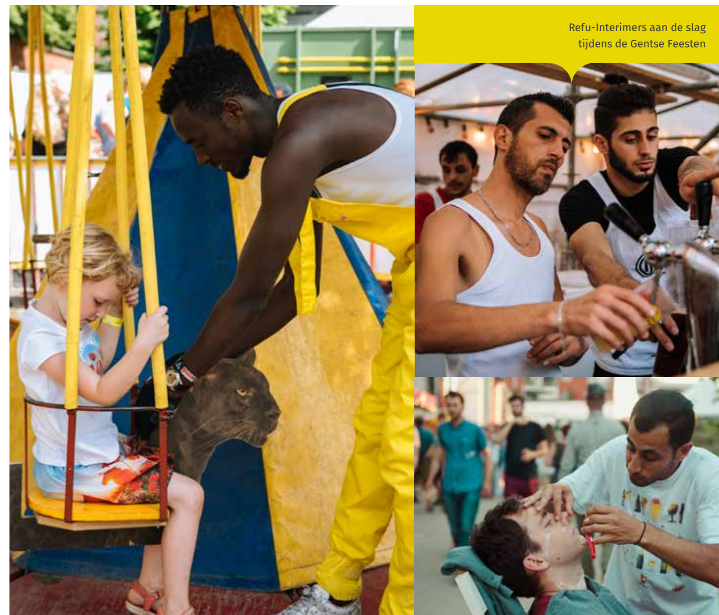
Refu-Interimers aan de slag tijdens de Gentse Feesten