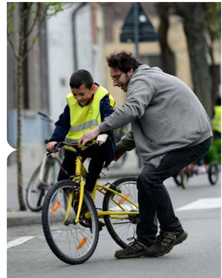
Nieuwkomers leren fietsen