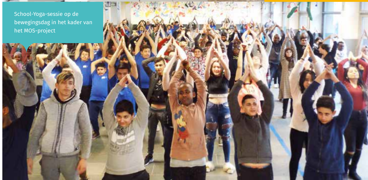
School-Yoga-sessie op de bewegingsdag in het kader van het MOS-project