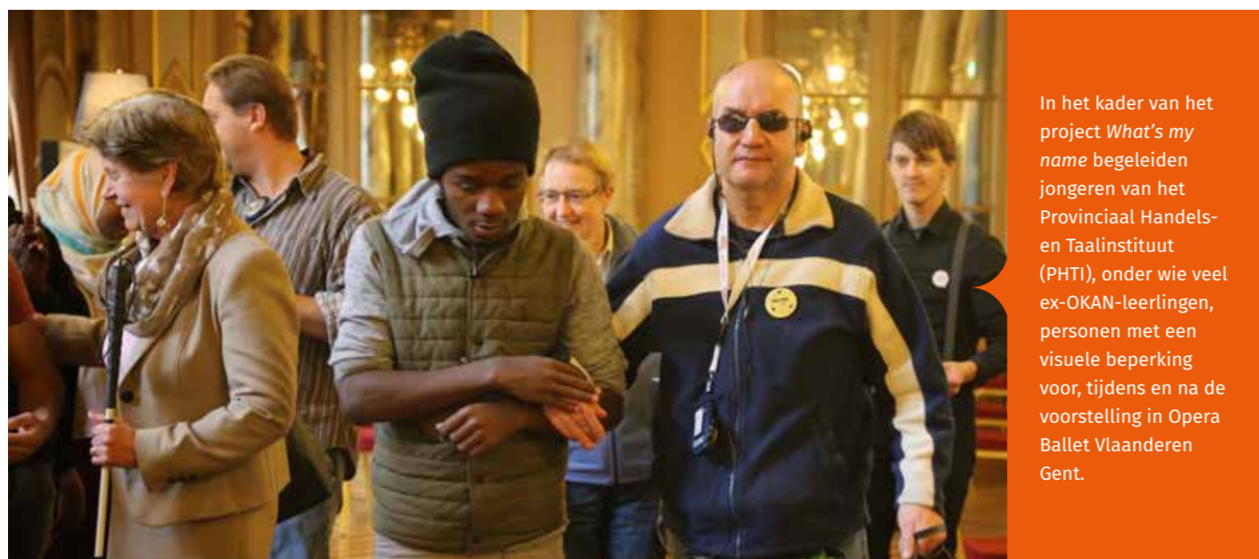
In het kader van het project What's my name begeleiden jongeren van het Provinciaal Handels- en Taalinstituut (PHTI), onder wie veel ex-OKAN-leerlingen, personen met een visuele beperking voor, tijdens en na de voorstelling in Opera Ballet Vlaanderen Gent.