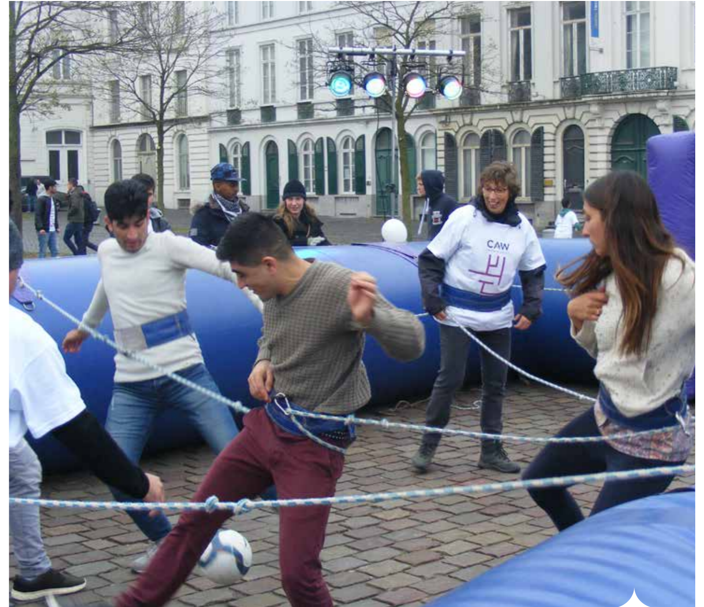
Tijdens de Warmste Week (2016) organiseerden het CAW Oost-Vlaanderen en Decathlon een tornooi levend tafelfoetbal voor Gentenaars en nieuwkomers.