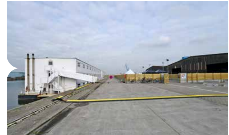
Het tijdelijke opvanginitiatief De Reno

Op die manier vonden gemeenschappelijke noden bij de opvanginitiatieven vaak een oplossing via het samenwerkingsmodel van de Taskforce. Zo werken heel wat middenveldorganisaties in de zomer op een lager pitje, met een kleiner vrijetijdsaanbod als gevolg. Die leemte werd na een oproep ingevuld met zinvolle initiatieven: politieagenten gaven verkeerseducatie aan mensen op de vlucht om hen veilig te leren fietsen in de stad.