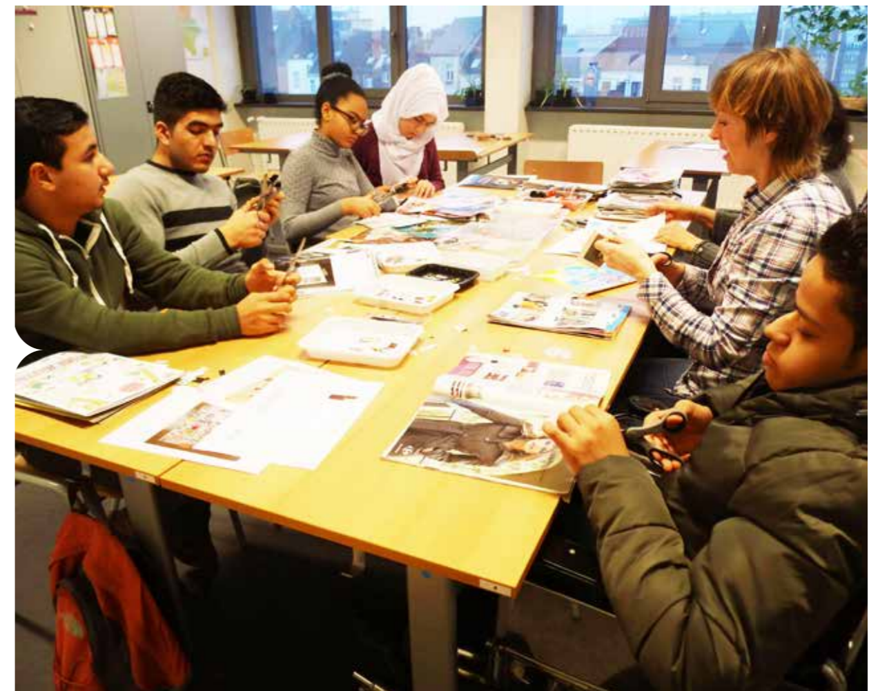
© Mieke Broothaerts (Toren van Babel)