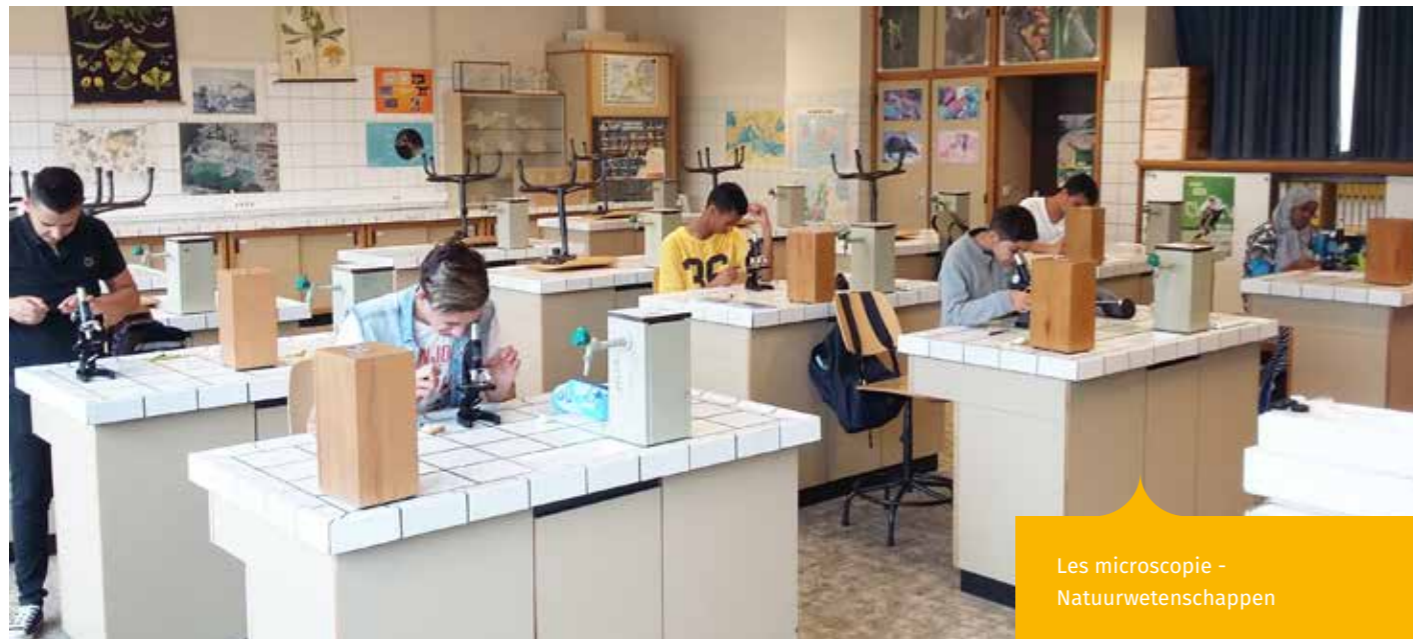
Les microscopie - Natuurwetenschappen