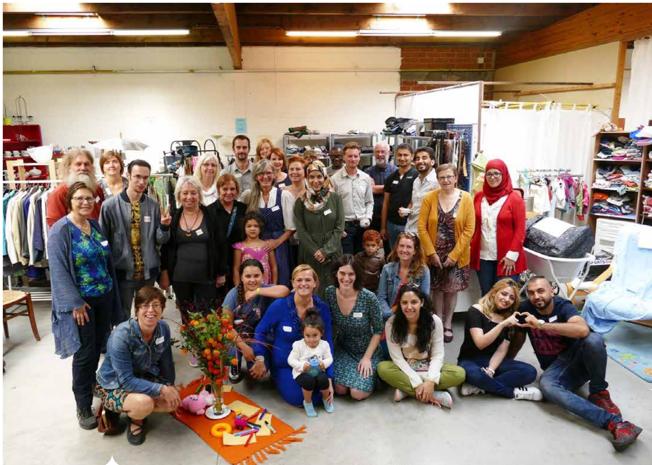
Ca. 100 vrijwilligers, waarvan een derde nieuwkomers, staan in voor de werking van Een Hart voor Vluchtelingen.