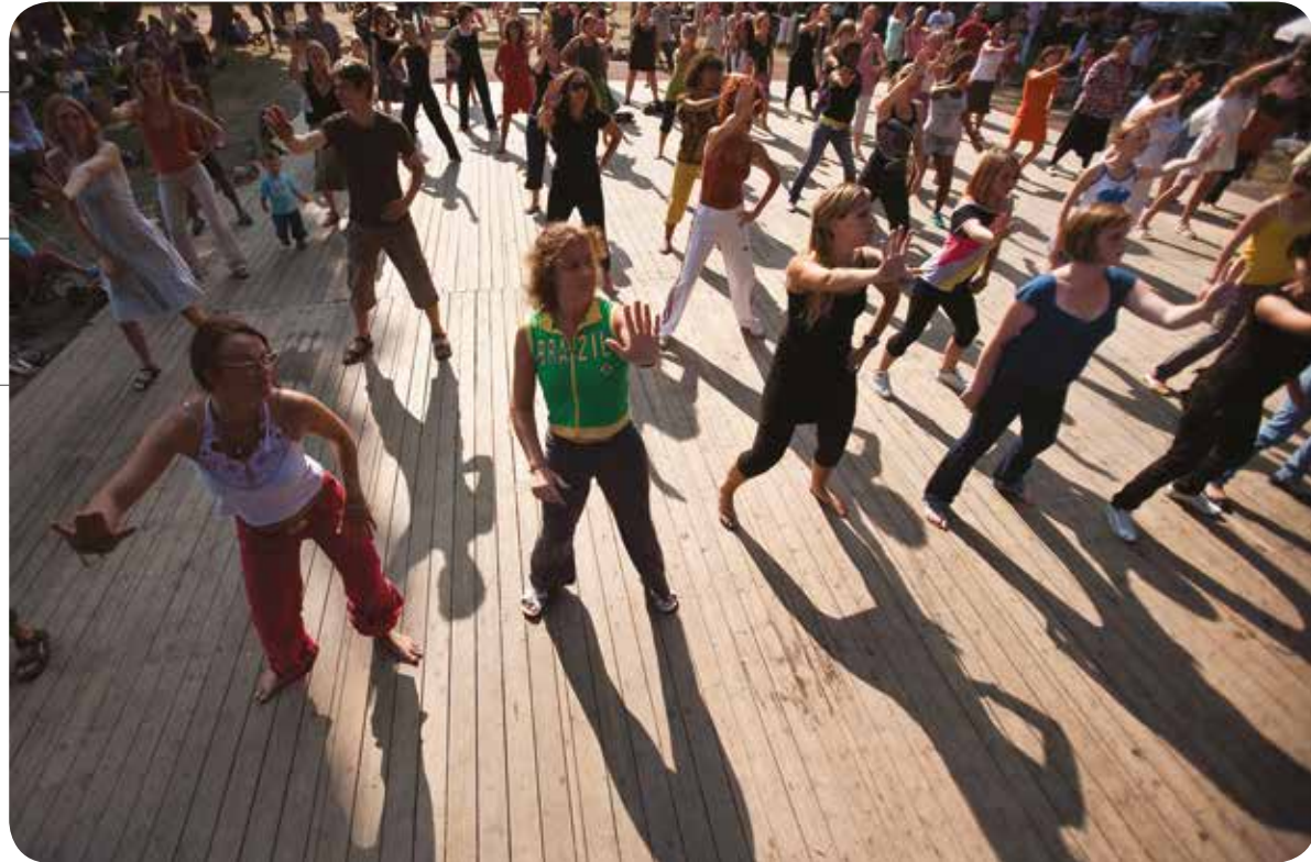
↑ DANSEN IN 'T PARK, EEN JAARLIJKS LAAGDREMPELIG DANSFEEST IN HET AZALEAPARK (SINT-AMANDSBERG)