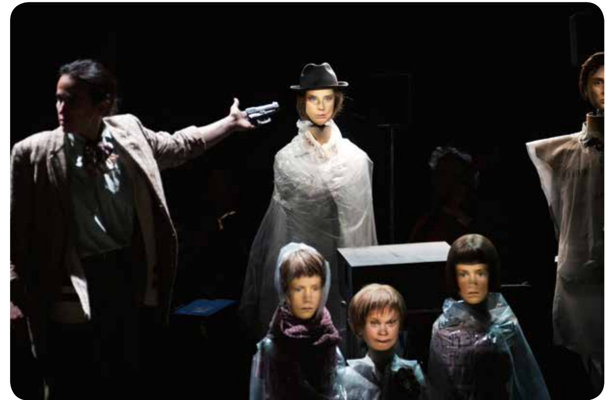
↑ VOORSTELLING 'L'AUTRE HIVER' VAN LOD TIJDENS MONS 2015

Gent is stichtend lid van het Similar Cities Network waarin zeven gelijkaardige steden kennis delen. Gent, Utrecht, Aarhus, Bologna, Edinburgh, Malmö en Stuttgart zijn steden die met zeer gelijkaardige uitdagingen te maken hebben en op Europees niveau willen samenwerken en de krachten bundelen. Elk van deze steden heeft een universiteit van topniveau en zet ook de aanwezige wetenschappelijke kennis mee in het netwerk