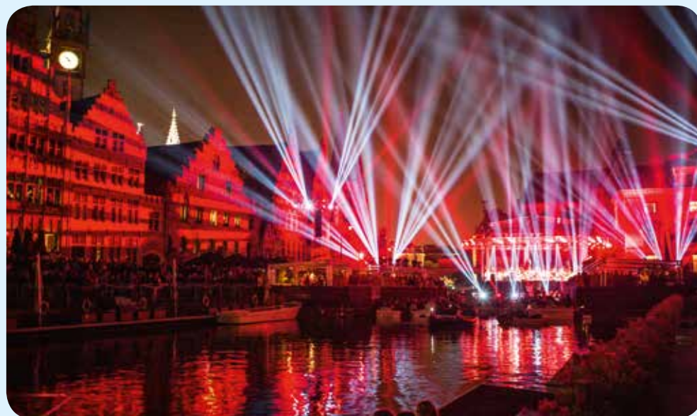
ODEGAND, EEN VAN DE TALLOZE MUZIEKINITIATIEVEN DIE GENT MAKEN TOT UNESCO CREATIVE CITY OF MUSIC