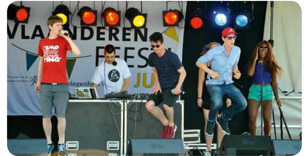
LAAGDREMPELIG, CULTUREEL FAMILIEFEEST MET EEN RUIM EN DIVERS ACTIVITEITENAANBOD IN HET KADER VAN HET FEEST VAN DE VLAAMSE GEMEENSCHAP