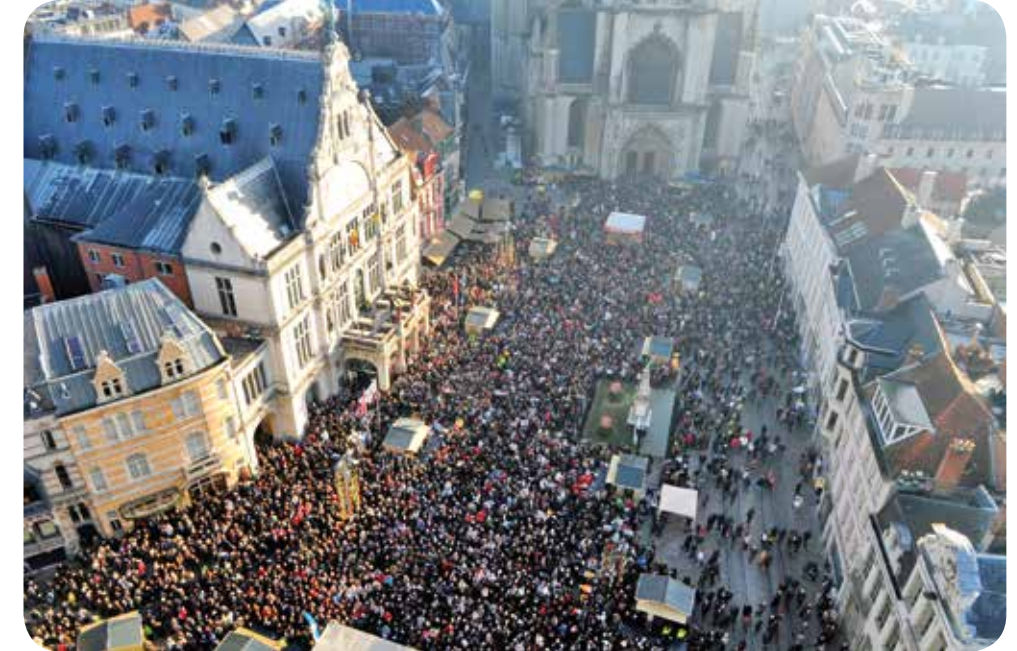
↑ DE STAD WENST HAAR INWONERS EEN GELUKKIG EN GEZOND NIEUWJAAR DOOR EEN TRAKTATIE VAN GRATIS DRANKJES EN ENTERTAINMENT SINDS 2000