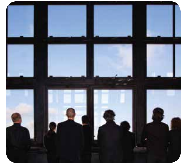
† HET INSTRUMENTAAL ENSEMBLE SPECTRA PROMOOT INTERNATIONAAL NIEUWE MUZIEK UIT VLAANDEREN

col zal ook omschrijven hoe steden betrokken wordt bij de opmaak van beheersovereenkomsten met Vlaamse kunstinstellingen op hun grondgebied. Concreet gaat het voor Gent dan over de beheersovereenkomst tussen Vlaanderen en Kunsthuis Opera Vlaanderen Ballet Vlaanderen. Het nieuwe kunstendecreet biedt een uitgelezen kans om rechtstreeks overleg te plegen met de Vlaamse overheid en onze bekommernissen in verband met het Gentse kunstenveld te delen. We zullen deze kans uiteraard ten volle grijpen. Daarom werkten we ook actief mee aan de landschapstekening die vanuit de VVSG over het kunstenveld wordt opgemaakt.