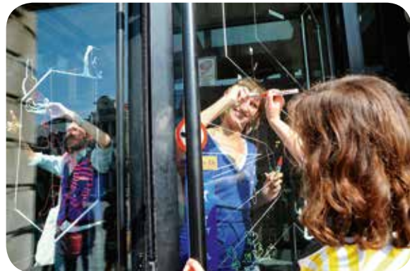
TEKENAARS AAN HET WERK TIJDENS 'THE BIG DRAW' (2013), EEN ORGANISATIE VAN KUNSTWERKT VZW IN SAMENWERKING MET VELE GENTSE PARTNERS

In de zomer van 2014 was er alweer een tweede editie van het succesvolle evenement 123piano. Naast een aantal locaties die tijdens de eerste editie al druk bespeeld werden zoals het Sint-Pietersstation, de stadshal, de bibliotheek, het pierkespark en DOK, kwamen er nog een aantal nieuwe piano's bij op de Kouter, aan de Minard en de Zebrastraat. Het succes van deze acht stadspiano's, waar iedereen mag op spelen, blijft maar groeien. Daarom zal dit project elk jaar opnieuw worden hernomen en streven we naar samenwerkingsverbanden met lokale cultuur-, onderwijs- en welzijnsorganisaties om dit project nog te versterken.