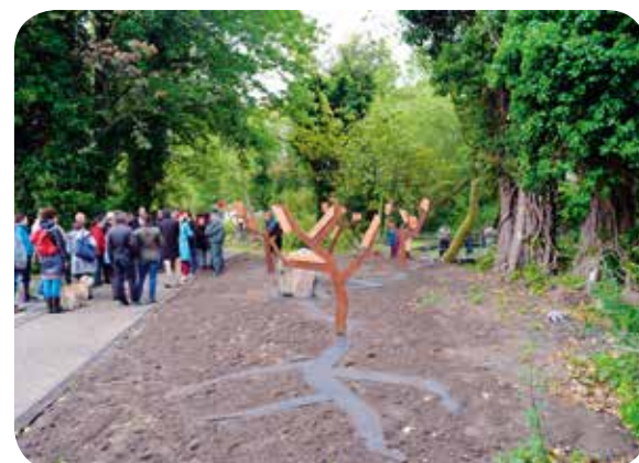
KUNSTWERK VAN PATRICK CORILLON IN HET NIEUWE BLOEMEKENSARK

en amateurkunstverenigingen. Zo'n kweekvijver heeft alleen maar kans op slagen als er ook voldoende door-groeimogelijkheden zijn. Daarom investeren we onder andere in culturele infrastructuur, in speelplekken en gezelschappen, en werken we een cultuurparticipatiebeleid uit waardoor zoveel mogelijk mensen geprikkeld worden om deel te nemen aan dat aanbod.