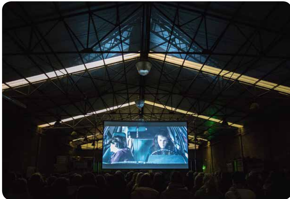
← CINE PRIVÉ, FILMFESTIVAL OP UITZONDERLIJKE LOCATIES (EDITIE 2015: HAVEN VAN GENT)

Dankzij de unieke invulling die de voorbije jaren is uitgewerkt, beschikken we met Circa over een cultuurcentrum dat als partner op het terrein fungeert om producties mee mogelijk te maken. Het gaat daarbij om unieke culturele projecten die innovatief zijn op vlak van methodiek, inhoud, doelpubliek, aanpak, partnerschap, ... en die inspirerend kunnen zijn voor andere actoren. Met deze vernieuwende invulling van het begrip 'cultuurcentrum' zijn we overigens voortrekker in Vlaanderen, waar ook andere cultuurcentra zich steeds meer gaan richten op (co)productionele samenwerkingsverbanden en locatieprojecten in plaats van een eigen programmering en receptieve werking. De werking van Circa zal bovendien worden ingebed in het grote geheel van de Cultuurdienst, wat de onderbouw en slagkracht nog versterkt (zie ambitie 10.)