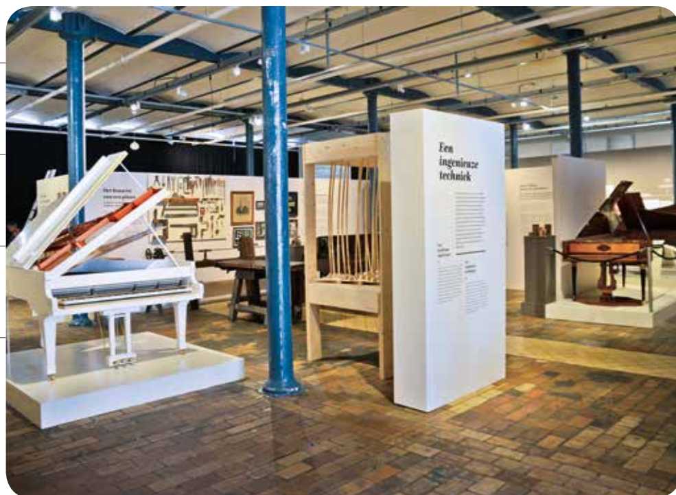
← IMPRESSIE VAN DE EXPO 'PIANO EN CO. 250 JAAR BELGISCHE PIANO-INDUSTRIE' IN HET MIAT

Voor het MIAT voorzien we 1.450.000 euro voor de renovatie van het dak en het vernieuwen van de museale opstelling op de 5 de verdieping. Investeren in de vernieuwing van de permanente opstelling is een belangrijke opstap naar het versterken van de inhoudelijke werking en de publiekswerking van het museum.