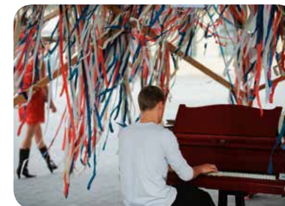
123-PIANO, EEN SUCCESVOL PARTICIPATIEF PROJECT DAT CULTUUR OP STRAAT BRENGT