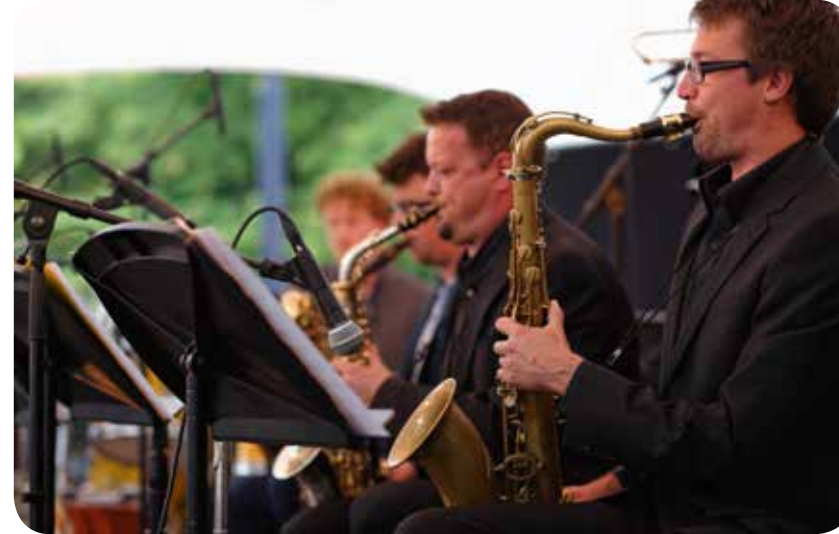
↑ JAZZ IN 'T PARK, GRATIS STADSFESTIVAL IN EEN ONGEDWONGEN SFEEER IN HET ZUIDPARK