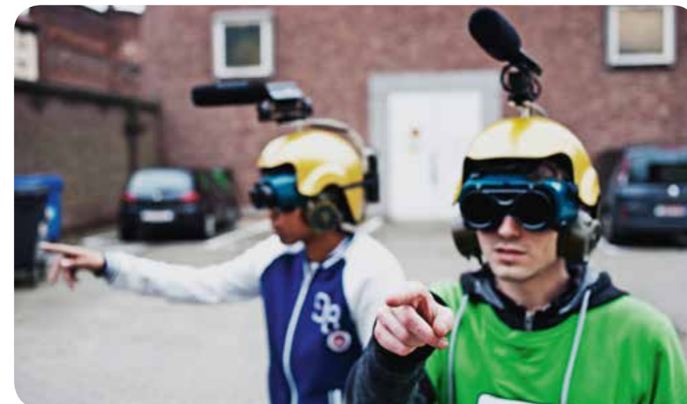
PROJECT 'BLINDDATE' VAN AIFOON

Daarnaast werken we als Stad ook aan enkele concrete cultuureducatieve projecten . Met De Kleine Cervantes kennen jongeren van 12 tot 15 jaar de jeugdliteratuurprijs van de Stad Gent toe voor het beste jeugdboek na een intensief leestraject en een argumentatiestrijd. Met de participatie in Tumult.fm maken we studenten warm voor cultuur. Sinds 2012 werken tal van organisaties en muzikanten samen in een Platform muziekeducatie, dat onder andere de dag van de muziekeducatie organiseert.