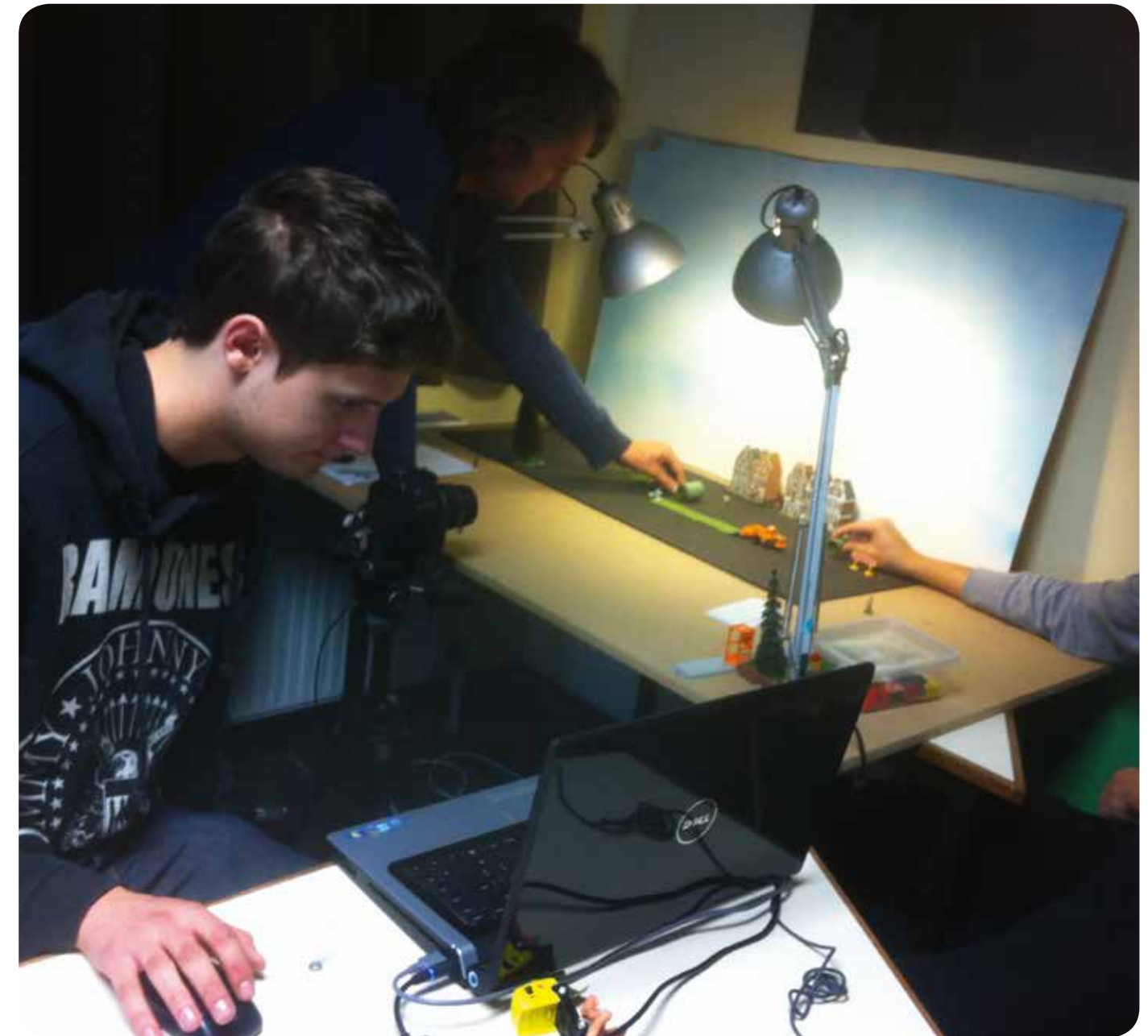
TV EKKERGEM IN ACTIE (BUURT- EN WIJKPROJECT MET FINANCIËLE ONDERSTEUNING VAN STAD GENT)

De subsidies die via dit reglement worden toegekend worden ook steeds afgestemd op andere subsidie-mogelijkheden, onder meer het stedelijk reglement voor de subsidiëring van initiatieven ter bevordering van het interculturele en inter-levensbeschouwelijke samenleven & Wijk aan Zet.