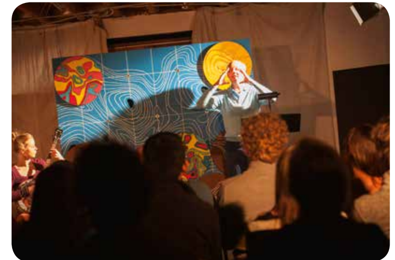
→ VOORSTELLING 'MENEER AFZAL' VAN LOD, IN EEN HUISKAMERTOURNEE IN SAMENWERKING MET CIRCA