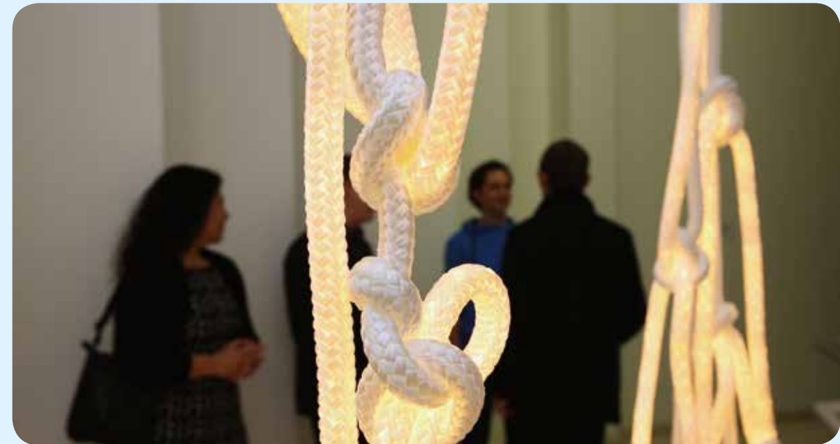
→ OPENING TENTOONSTELLING 'LIGHTOPIA' (DESIGN MUSEUM GENT)

Het museumlandschap in Gent is bijzonder rijk, met maar liefst 7 van de 21 landelijk erkende musea. Naast het Museum Dr. Guislain zijn er ook zes stedelijke musea, drie erfgoedmusea en drie musea voor kunst en design: het STAM, het MIAT, het Huis van Alijn, het S.M.A.K., het MSK en het Design museum Gent. Elk van deze musea heeft een specifieke inhoud en samen zijn ze complementair.