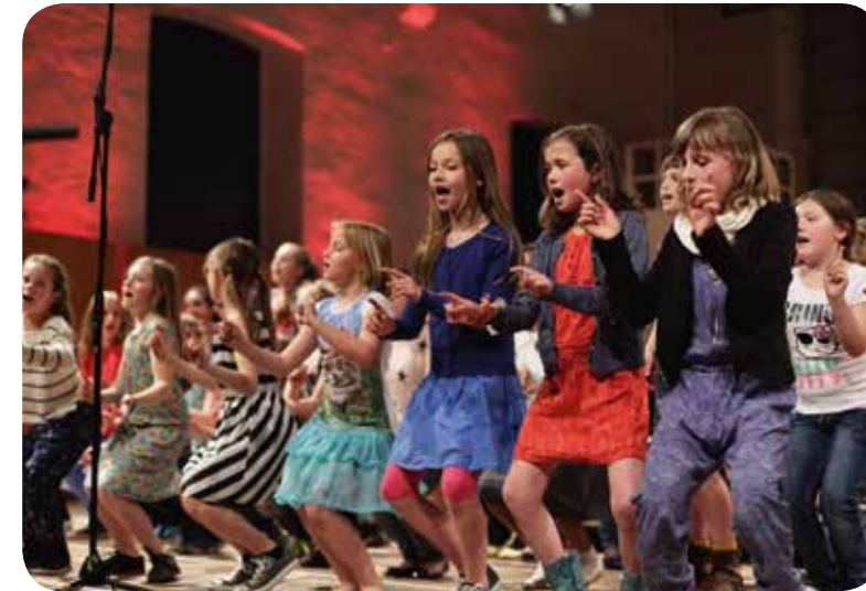
† CÔTÉ KOER - KINDERZANGFEEST: BRENGT DE KUNSTENAARS EN HET PUBLIEK VAN MORGEN OP DE PLANKEN. EEN PROJECT VAN MUZIEKCENTRUM DE BIJLOKE MET JENAPLANSCHOOL DE FENIKS EN DE KLEURDOOS

Het nieuwe kunstendecreet wil onder andere het Vlaamse kunstenbeleid en het stedelijke kunstenbeleid meer op elkaar afstemmen. Daarom zal er bij het begin van de nieuwe legislatuur op Vlaams niveau een protocol worden afgesloten tussen de Vlaamse overheid en de Vereniging van Vlaamse Steden en Gemeenten (VVSG), de Vereniging van Vlaamse Provincies (VVP) en de Vlaamse Gemeenschapscommissie (VGC) voor Brussel. In dit protocol zal duidelijk worden hoe deze partners hun beleidsintenties ten aanzien van hun kunstactoren kenbaar maken aan Vlaanderen, hoe zij betrokken worden bij de opmaak van de visienota van de minister over het kunstenveld, en hoe ze gehoord zullen worden na de beoordelingsprocedure. Dit proto-