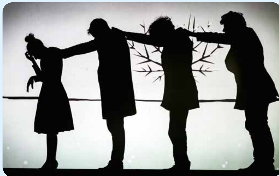
VOORSTELLING 'KEIK' VAN 4HOOG

De huidige ondersteuning van het sociaal-culturele verenigingsleven zal worden verder gezet en het huren van zalen voor verenigingen zal administratief vereenvoudigd worden om de toegang tot bepaalde zalen te versterken. Daarnaast worden de specifieke werkingstoelagen voor amateurkunsten uitgebreid. De subsidiëring van de sector van de amateurkunsten in Gent spitst zich sinds vele jaren toe op de sectoren die het sterkst vertegenwoordigd zijn in deze stad: het amateurtheater en de instrumentale muziekensembles. Deze reglementering zal worden uitgebreid naar de globale niet-professionele podiumkunstensector zodat ook andere disciplines zoals dans, muziektheater, koren en de diverse mengvormen in deze sector een beroep kunnen doen op werkingssubsidies.