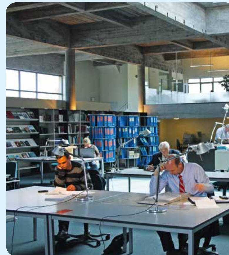
VRIJWILLIGERS AAN DE SLAG BIJ HET STADSARCHIEF (ZWARTE DOOS)

Om het maatschappelijk draagvlak voor erfgoed te versterken, is het belangrijk om het erfgoed actief te ontsluiten. Met verschillende initiatieven willen we het erfgoed toegankelijk en publiek maken. De verworven kennis wordt aan het publiek bekend gemaakt via de Open Monumentendag, de Dag van de Architectuur, de Dag van het Historisch Onderzoek samen met het STAM, de Kruiwagenavonden, de thematochten die samen met de vriendenkringen worden uitgewerkt, de nocturnes in De Zwarte Doos, lezingen en rondleidingen. Daarnaast wordt het erfgoed ook ontsloten door heel wat publicaties: de jaarlijkse voorjaarslezingen en de lezingen tijdens de Gentse Feesten, wijkwandelingen tijdens de Gentse Feesten, de Open Monumentendag, Mijn Border Mijn baksteen, en enkele thematische uitgaven.