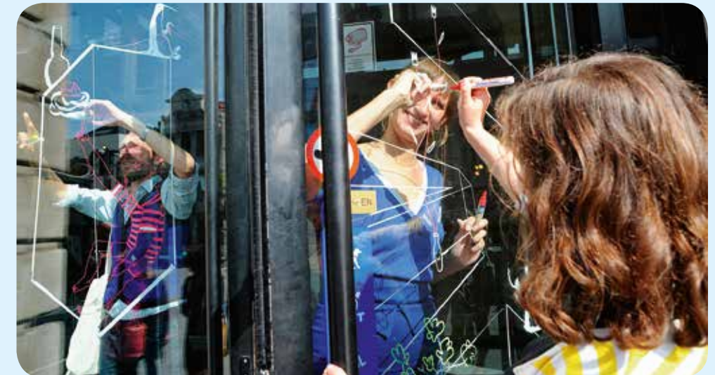
TEKENAARS AAN HET WERK TIJDENS 'THE BIG DRAW' (2013). EEN ORGANISATIE VAN KUNSTWERKT VZW IN SAMENWERKING MET VELE GENTSE PARTNERS