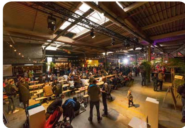
↑ FOODFESTIVAL OP DE POP-UP SITE KERK (GENTBRUGGE)