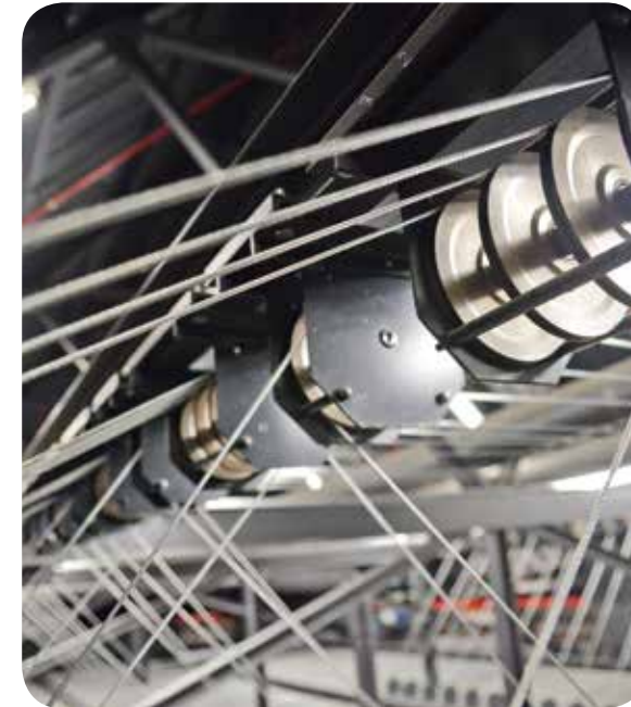
VERNIEUWDE TREKKENWAND IN DE MINARDSCHOUWBURG

Daarnaast zet de Stad al jaren in op het ontwikkelen van aangepaste infrastructuur in de verschillende wijken. Veel amateurgezelschappen en culturele verenigingen zoeken immers in hun eigen buurt hun vaste stek voor ontmoeting, repetitie en een tentoonstelling. De afgelopen jaren werd al een grote inhaaloperatie doorgevoerd voor het renoveren van dergelijke wijksalen en ontmoetingsplekken. Zo werden onder meer het Heilig Hart, het Lakenmetershuis, de Scala, de Waanzin, Krakeel, SIVI De Welvaart, Novacentrum en het Cultureel Centrum Meulestede met investerings-subsidie van de Stad Gent gerenoveerd. In deze beleidsperiode worden middelen voorzien voor enkele kleine werken aan De Campagne in Drongen en de Sint-Amanduskapel aan Campo Santo in Sint-Amandsberg. We voorzien ook de ingebruikname van het volledig vernieuwde Dienstencentrum Ledeberg, waarbij het gebruik van 3 volwaardige receptieve ruimtes (inz. de compleet vernieuwde polyvalente zaal) met verhuur door Circa een belangrijke meerwaarde zal zijn voor het Gentse verenigingsleven.