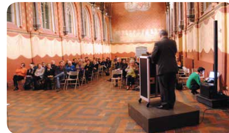
↑ DAG VAN HET HISTORISCH ONDERZOEK IN HET STAM

Zowel de Stad Gent als het OCMW hadden in het verleden een eigen archief. De afgelopen jaren werd gewerkt aan het project DIA (digitale archivering). Als een gevolg van de in 2013 besliste hervorming van de stadsdiensten zullen Stad en OCMW voortaan één gemeenschappelijk archief hebben. Via deze centrale archiefdienst en het gemeenschappelijke DIA-project zal de archivering in de toekomst nog meer gestroomlijnd verlopen.