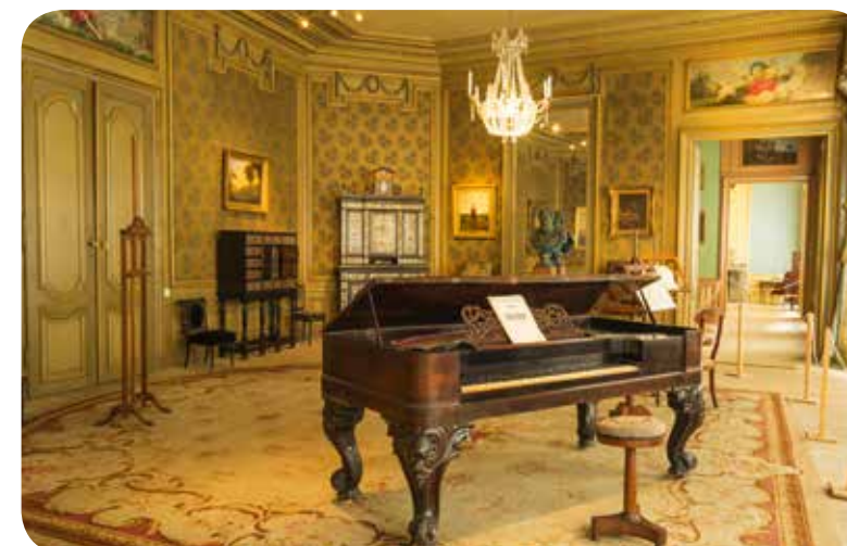
↑ PIANO-KAMER IN HOTEL D'HAENE STEENHUYSE