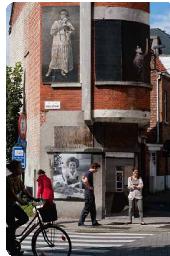
↑ BUURTPROJECT 'ECHO'S UIT DE WIJK' IN DE DAMPOORTWIJK

Tegelijk kijken we ook buiten onze landsgrenzen. Gent heeft een erkenning als UNESCO Creative City of Music en speelt al jaren een actieve rol in verschillende Europese netwerken, gaande van EUROCITIES over LUCI tot AVIAMA (Association internationale des Villes Amies de la Marionette).