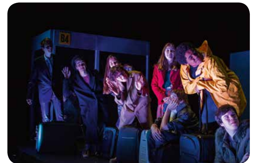
† VOORSTELLING VAN LARF! TIJDENS HET FESTIVAL 'BREEK 'N BEEN' (2015)

Daarnaast voorzien we voor de kunstensector ook logistieke, infrastructurele en projectmatige ondersteuning. Die komt verder in deze beleidsnota uitgebreid aan bod.