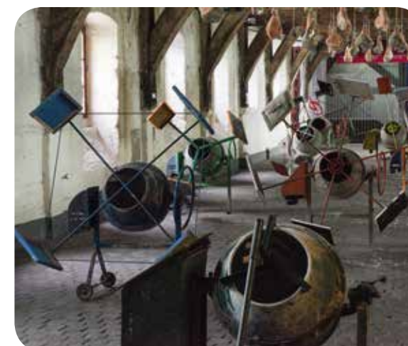
↑ INSTALLATIE 'SANCHO DON'T CARE' VAN WILLEM BOEL, OPGESTELD IN HET GROOT VLEESHUIS TIJDENS HET KUNSTENFESTIVAL TUMULTINGENT (MAART 2015)

'Artiest zoekt Feestneus' is uitgegroeid tot een druk bevroagde formule, waarbij een uitgebreid gamma aan artiesten speelkansen worden geboden op straat- en buurtfeesten, verspreid over de stad. Doorheen de jaren is het accent meer komen te liggen op het subsidiëren van buurtfeesten waar vaak naar hetzelfde repertoire van artiesten wordt gevraagd. Hierdoor kwam het oorspronkelijke doel, doorgroeikansen creëren voor beginnende artiesten, iets meer op de achtergrond. We brengen een aantal verbeteringen aan dit concept om de speelkansen voor beginnende artiesten te verbreden. We willen meer kansen creëren voor nieuwe artiesten en nieuwe speelplekken. Het reglement wordt geëvalueerd en herdacht tot een nieuw concept.