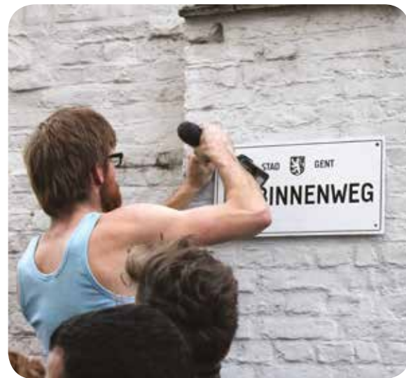
↑ DE WERKING VAN HET KUNSTENAARSCOLLECTIEF ZWART WILD VOND TIJDELIJK EEN PLEK IN DE BINNENWEG (BRUGSE POORT)

Het stadsbestuur investeert onder impuls van de schepen van economie ook in co-workingplaces waar creatieve ondernemers een werk-, vergader-, of ontmoetingsplek kunnen vinden. Creatief Kwartier Rabot is een eerste concrete realisatie van dit beleid. Dit levert zeker ook extra kansen op voor de brede cultuur- en kunstensector waar tal van creatieve ondernemers aan de slag zijn.