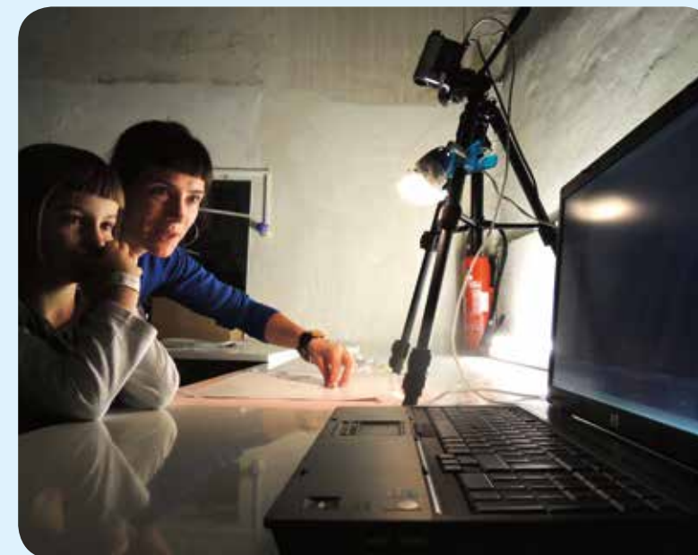
AAN DE SLAG MET OUDE EN NIEUWE MEDIA TIJDENS HET 'MEDIALAB' VAN CIRCA

Voor de jaarlijkse stadseigen evenementen voorziet de stad 440.000 euro per jaar, en die worden zoveel mogelijk georganiseerd in co-creatie met andere culturele spelers. Het instrument van Circa als 'nomadisch cultuurcentrum' laat toe om flexibel in te spelen op vragen vanuit de sector naar concrete ondersteuning en samenwerking bij activiteiten en projecten. Doordat het cultuurcentrum geen vast gebouw heeft, brengen we kunst en cultuur dicht bij Gentenaars via locatieprojecten.