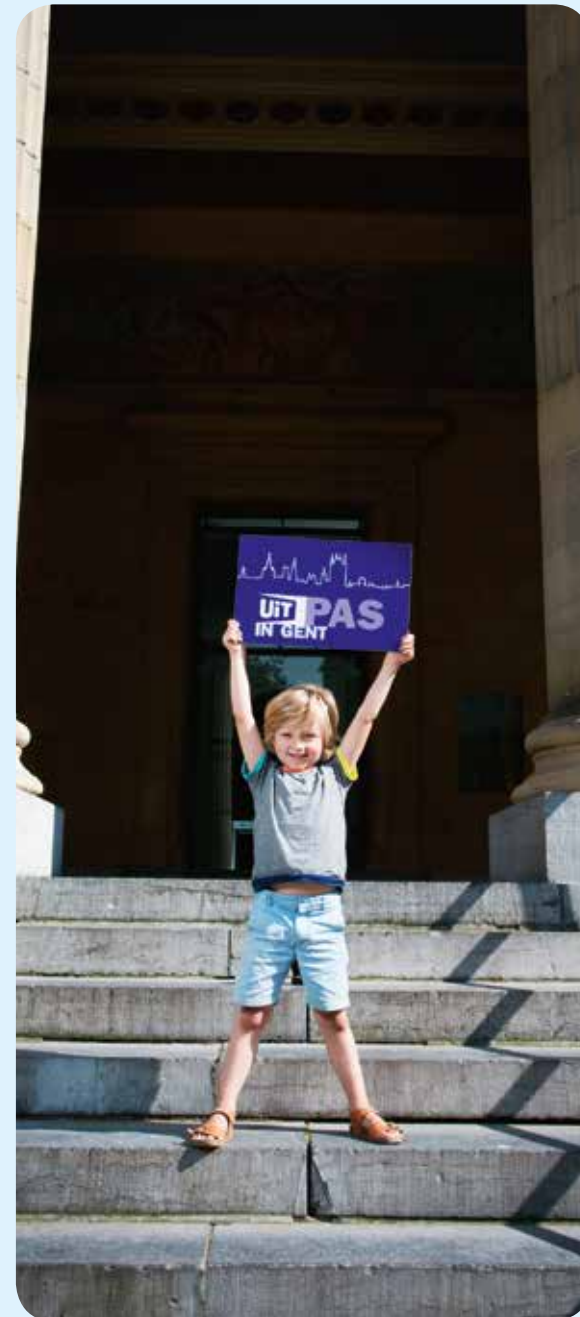
DE GENTSE UITPAS WERD GELANCEERD IN SEPTEMBER 2014

De Stad wil niet alleen kunst en cultuur letterlijk dichterbij mensen brengen, maar mensen ook stimuleren om zelf actief deel te nemen aan het vrijetijdsaanbod in de stad. Met UitPAS maken we een kansentarif mogelijk voor mensen in armoede, en geven we stimuli aan iedereen die regelmatig gebruik wil maken van het vrijetijdsaanbod. Maar een spaar- en kortingskaart alleen is niet voldoende om mensen zin te doen krijgen in culturele participatie. Daarom zal ook sterk worden ingezet op projecten die de inclusie van een gevarieerd publiek mogelijk maken.