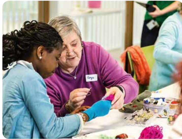
← 29 APRIL 2014 WAS DE EUROPESE DAG VAN DE INTERGENERATIONELE SOLIDARITEIT. GROEPJES VAN OUDEREN EN LAGERE-SCHOOLKINDEREN KWAMEN SAMEN OM IN DUO'S NIEUWE SOKKENPAREN TE MAKEN