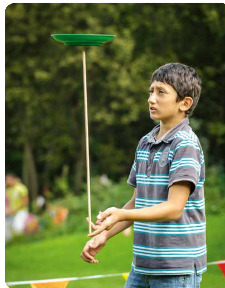
BUURTPROJECT 'BRUGSE POORT IN VUUR EN VLAM' VAN CIRCUSPLANEET

De podiumkunsten blijven een belangrijke deelsector van het stedelijk cultuurlandschap, zowel wat betreft de professionele en structurele actoren als wat betreft de semiprofessionele spelers en het projectmatige werk. In het kader van de betoelagingsronde 2013 van het Kunstendecreet bijvoorbeeld werden vanuit Gent 53 dossiers ingediend op een totaal van 356 over heel Vlaanderen. In 2014 putten de professionele actoren in Gent samen bijna 20 miljoen euro uit de 2- en 4-jaarlijkse subsidies van het Kunstendecreet. De structurele ondersteuning van de kunsten door de stad betreft een 50-tal actoren, samen goed voor jaarlijks meer dan 7 miljoen euro aan werkingsubsidies en ongeveer 2 miljoen euro aan investeringsubsidies.