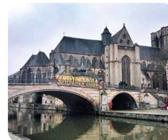
↑ GENT KUNST, JAARLIJKS EVENEMENT ROND BEELDDE KUNSTEN IN GENT

Daarnaast heeft Gent ook een mooie galeriescène die zowel nationale als internationale kunstenaars en opkomend talent vertegenwoordigt met een gevarieerd aanbod aan tentoonstellingen. Onder de noemer Gent Matinee plaatsen de Gentse galleries, die een platform bieden aan hedendaagse kunstenaars, vier keer per jaar hun activiteiten in de kijker. De Stad Gent ondersteunt dit initiatief promotioneel omdat galleries aan de kunstenaars de kans bieden om hun werk te vermarkten aaneen breed publiek. Hoe meer kunstenaars van hun kunst hun broodwinning kunnen maken, hoe beter voor de kunst en kunstenaars.