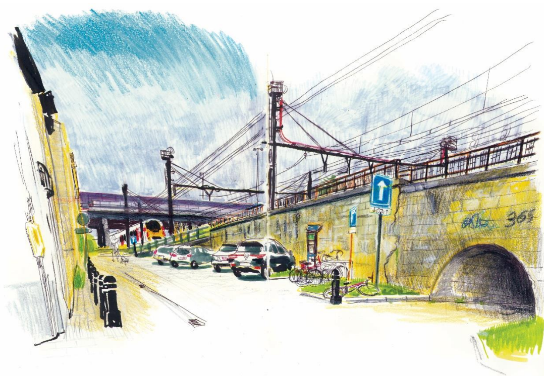
Afbeelding: Spoorwegtunneltje Frans Deconinckstraat

In 1923 werd deze stopplaats officieel opgeheven.