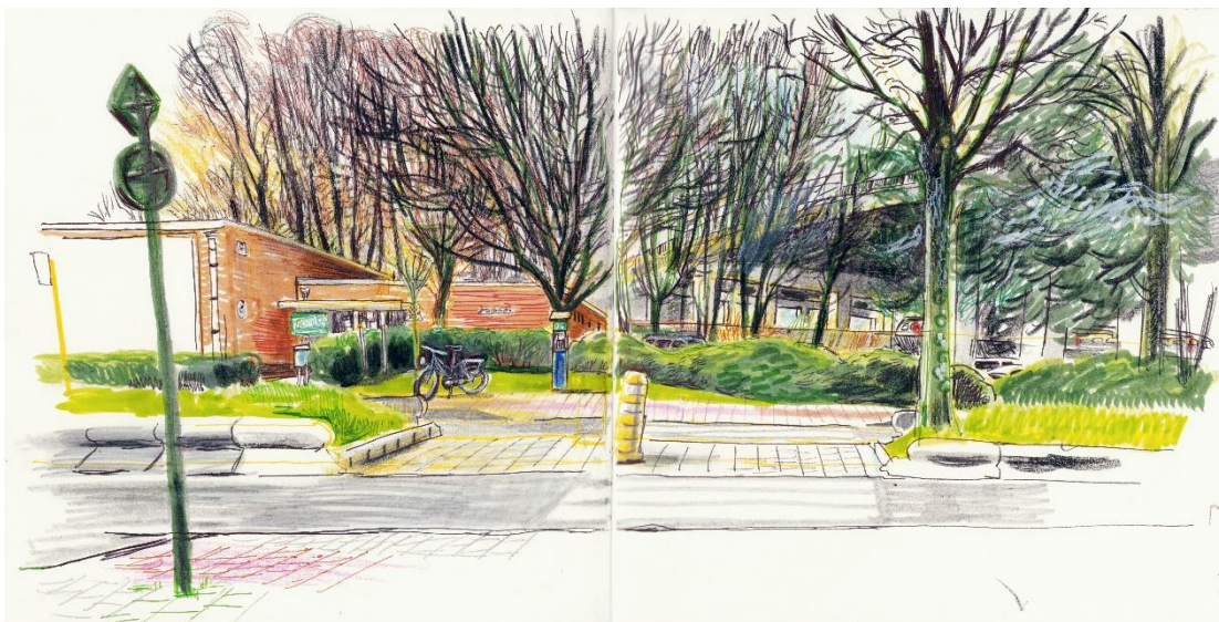
Afbeelding: Open Huis Botermarkt, Hundelgemsesteenweg © Jeroen Janssen

19. Tegenover het Wijkgezondheidscentrum staat het Open Huis te midden het groen. Jarenlang was het gebouwtje bekend onder de naam Clubhuis der Senioren. Toen het stadsbestuur besliste om de plek ruimer open te stellen waren er naast ontmoetingen voor senioren ook activiteiten van andere verenigingen: Ledeberg Doet het Zelf, Voedselbedeling Sociaal 9050, Kinderkoor Mais Quelle Chanson, het Takkenorkest, .... Deze plek wordt nieuw leven ingeblazen en omgevormd tot een buurthuis.