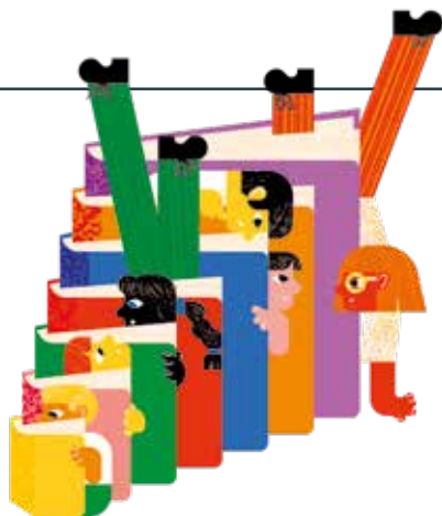
© Sam Vanbelle & Kris Demeij

+ fietstrack.ugent.be/gent • 09 266 28 00 (Mobiliteitsbedrijf)