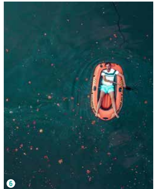
1 @INSTAPASCALEST Achtervisserij