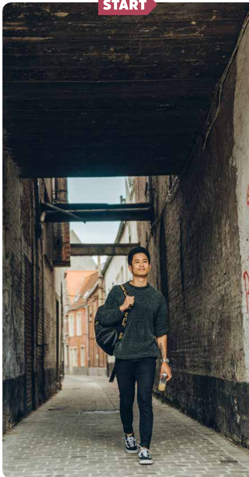
De Garensteeg is een populaire doorsteek tussen de Vrijdagmarkt en het Anseeleplein.

De vele Gentse steegjes ademen niet alleen historische charme. Ze dragen ook stuk voor stuk een bijzonder verhaal met zich mee.