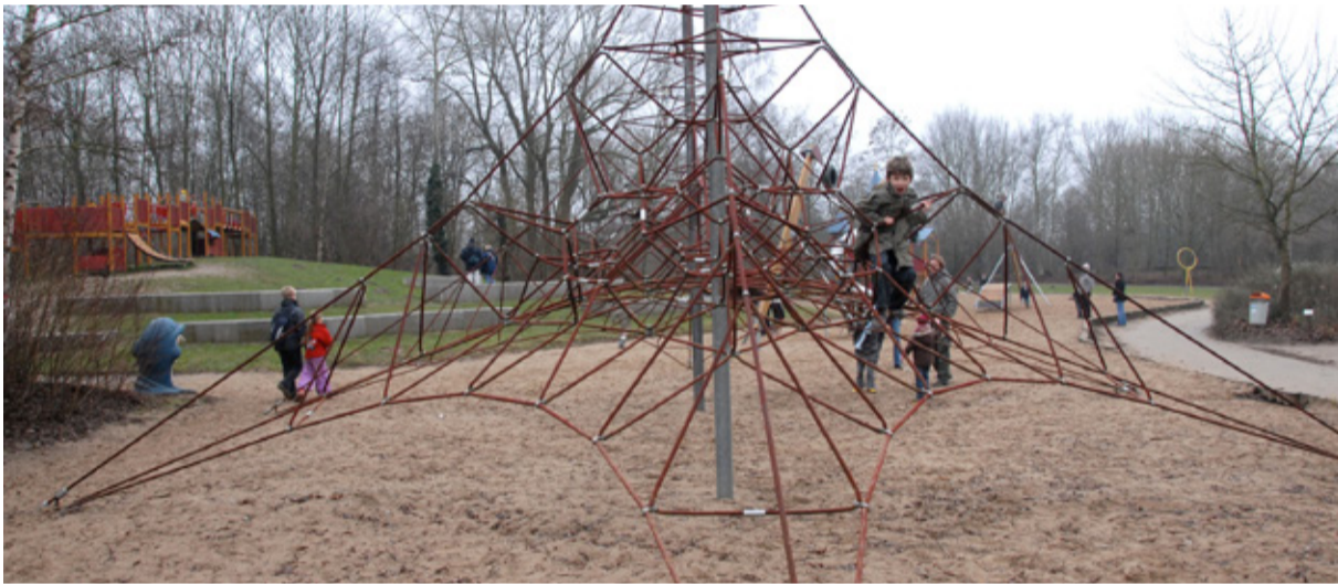
Dit type klimrek komt er in het Vorkparkje

Nog voor het bouwverlof van deze zomer krijgt het parkje in de Vorkstraat een nieuw klim- en speelnet. Daarna worden speelheuveltjes en een pad naar de achteruitgang van de school aangelegd. Later dit jaar volgen nog bankjes, een verzorgd kattenhotel en nieuwe kleurrijke bloemen, bodembedekkers en heesters. Kortom, het parkje zal er helemaal anders uitzien. Voor elk wat wils!