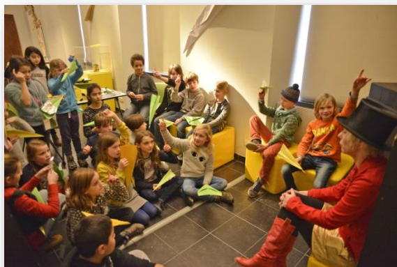
Huis van KINA