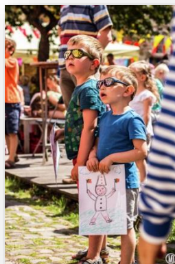
Huis van Alijn