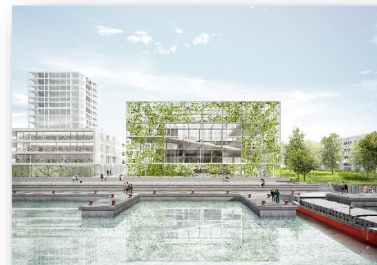
Ontwerp stadsgebouw Oude Dokken