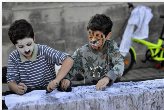
Uitbouw van een dekkend vakantieaanbod