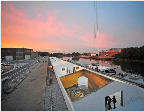
Tijdelijke invulling Oude Dokken

De kinderen en jongeren werden bevestigd rond de thema's leefbaarheid en veiligheid, en kregen daarnaast ook de kans om zelf nieuwe voorstellen te lanceren. Dat resulteerde in een themagericht rapport met beleidsaanbevelingen. Hun vragen en nieuwe ideeën werden beluisterd door het schepencollege en dienen als inspiratie voor een aantal aanpassingen in de wijk in de loop van het schooljaar 2018/2019. Zo werd ondertussen een politieke goedkeuring verkregen om zaken aan te brengen op de openbare weg. Dit wordt verder geconcretiseerd in 2019.