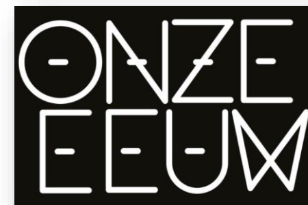
Infomoment rond verkiezingen