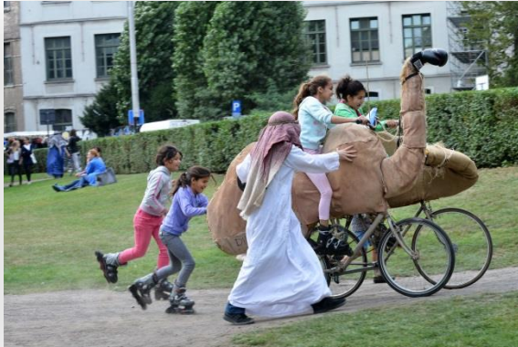
Wilde Mannen, Woeste Wijven