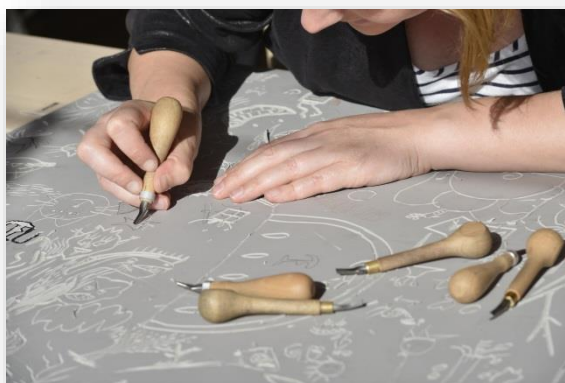
Uitbouw van een dekkend vakantieaanbod