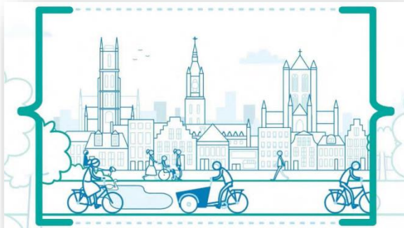
Ruimte voor Gent

middenveld om concrete aanbodverruiming op de huurmarkt via private initiatieven te ondersteunen. Middenveldorganisaties worden aangemoedigd om mee creatieve oplossingen te vinden inzake kwalitatieve betaalbare huisvesting voor kwetsbare groepen met een woonneed.