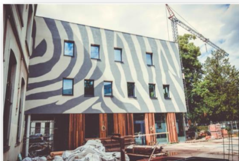
FOS De Zebra's