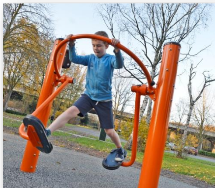
Buurtsporterrein Gentbrugse Meersen