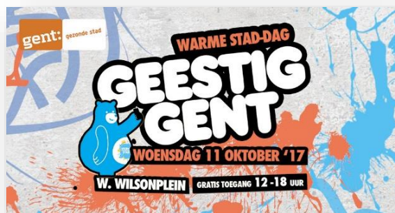
Warme Stad Gent