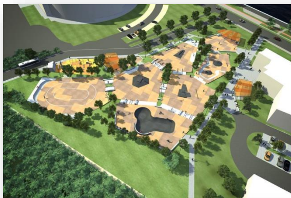
Ontwerp skatepark Blaarmeersen