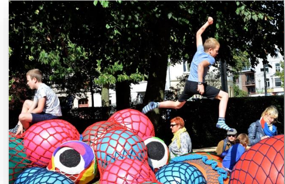
Wilde Mannen, Woeste Wijven