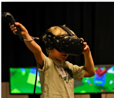
Bibliotheek De Krook