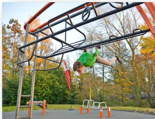
Buurtsporterrein Gentbrugse Meersen