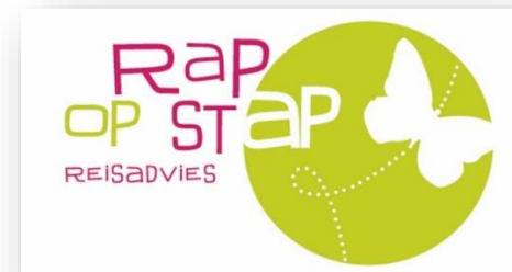
Extra kantoor in Ledeborg