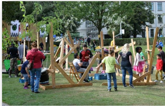
Wilde Mannen, Woeste Wijven