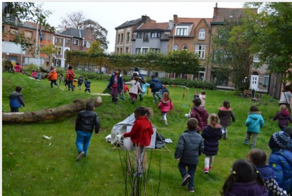
Schoolpark De Toverberg