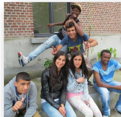
Jeugdwerk in Gent