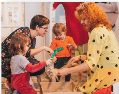
Peutertoer MIAT