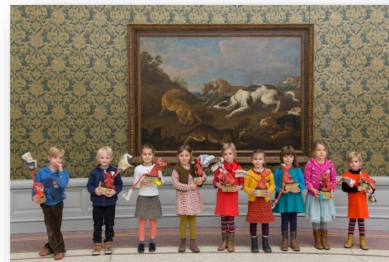
Museum voor Schone Kunsten (MSK)