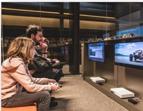
Bibliotheek De Krook