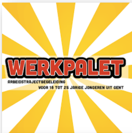
Werkpalet, gericht op kwetsbare jongeren