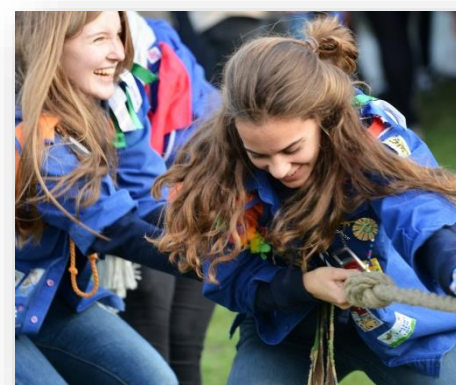
Jeugdwerk in Gent