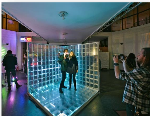
Tijdelijke invulling in NEST