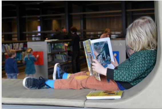
Stimulerende leesomgeving De Krook

aanwezig op school die ter plaatse de welzijnsvragen van ouders beantwoordt.