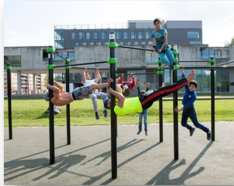
Uitbreiding van aantal buurtsportterreinen