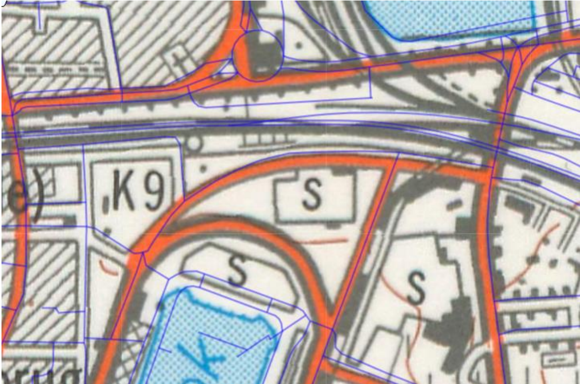
Figuur 7: NGI Basemap 1981

We zien de buurtweg zeer duidelijk terugkomen tot 1854, maar door de komst van de treinspoor lijkt de weg in 1904 al verdwenen. Vanaf 1939 is de weg duidelijk verdwenen en nemen de wegen in de buurt de vorm aan van de wegen zoals vandaag. Dit is nog duidelijker op de kaart van 1969 en 1981. Op de kaart van 1981 neemt het gebouw de vorm aan zoals die van vandaag.