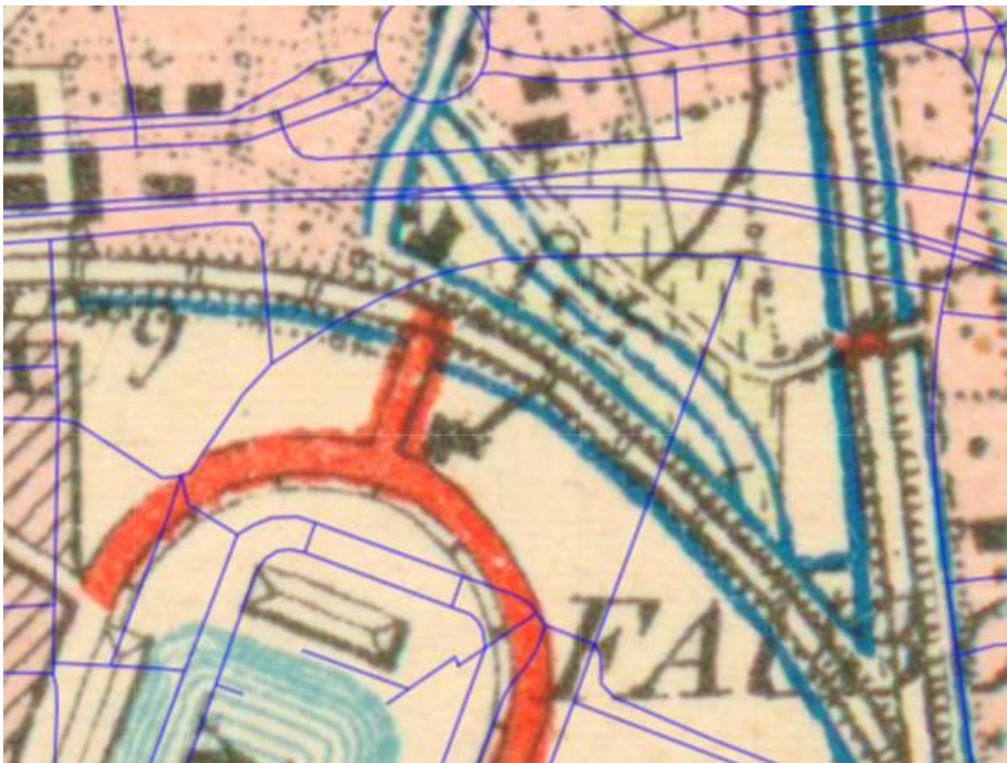
Figuur 4: NGI Basemap 1904