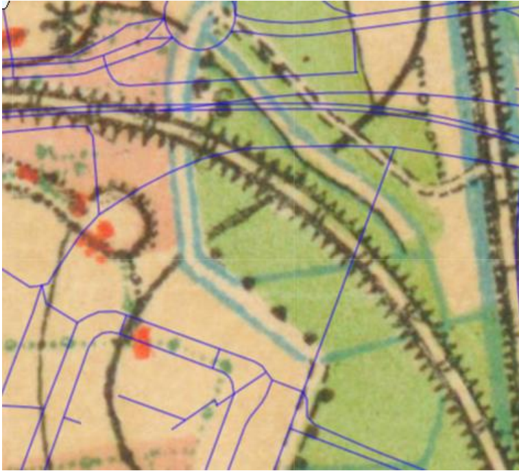
Figuur 3: NGI basimap 1873