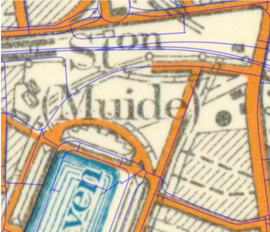
Figuur 5: NGI Basemap 1939