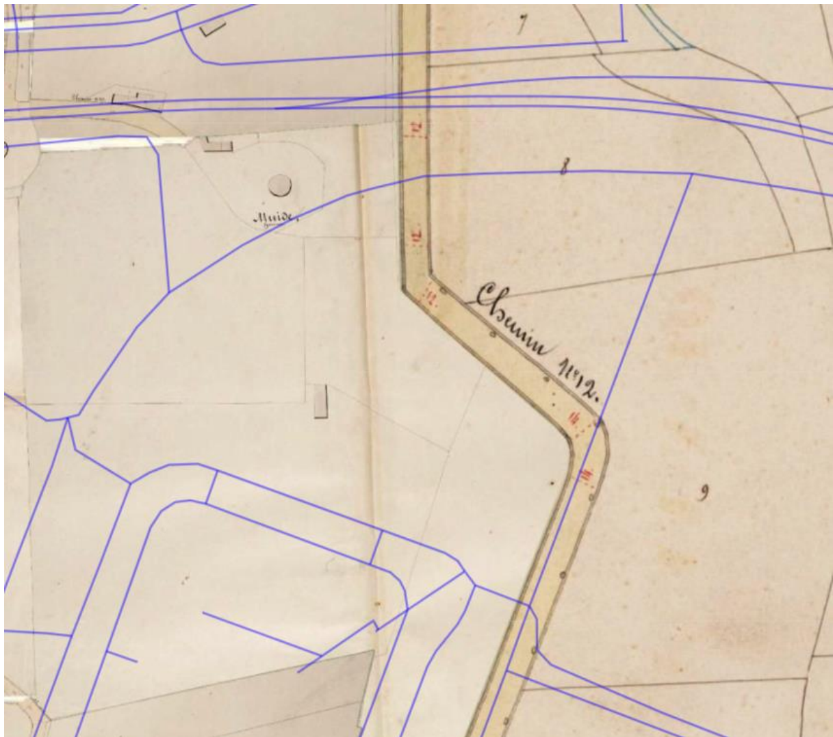
Figuur 1: Atlas der buurtwegen 1940

De buurtweg en omgeving op kaart door de jaren heen: