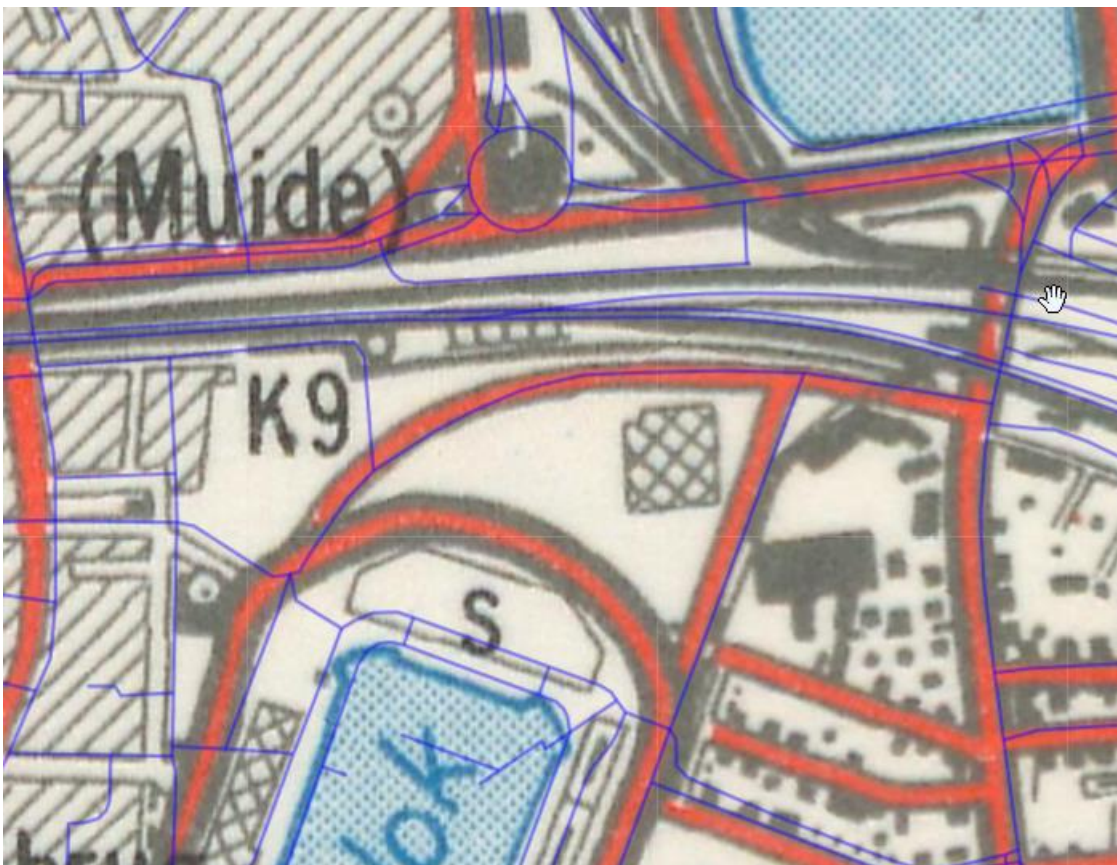
Figuur 6: NGI Basemap 1969