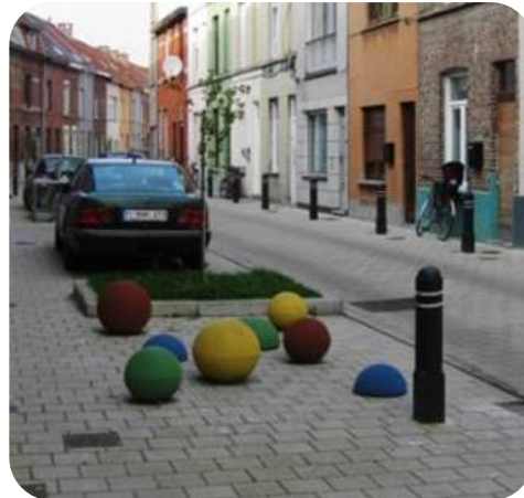
Spelprikkels in de stad