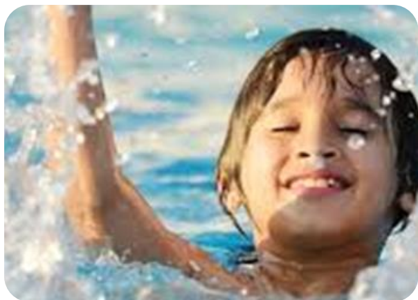
Uitbreiding gratis jeugdsport en gratis zwemmen tot 6 jaar