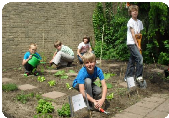
Proeftuinen op scholen