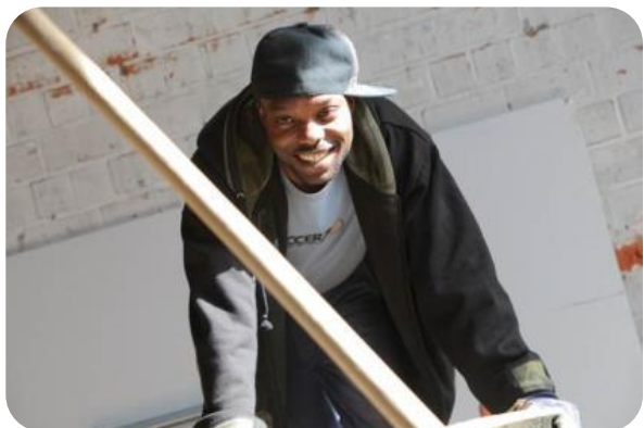
Acties ikv ondernemerschap en ondernemingszin in secundair onderwijs