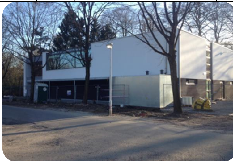
Nieuwe fuifzaal in Wondelgem