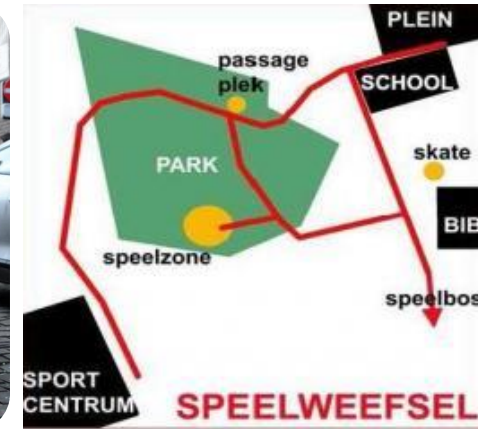
Realiseren speelweefsel bij stadsvernieuwingsprojecten en kindroute in de Brugse Poort