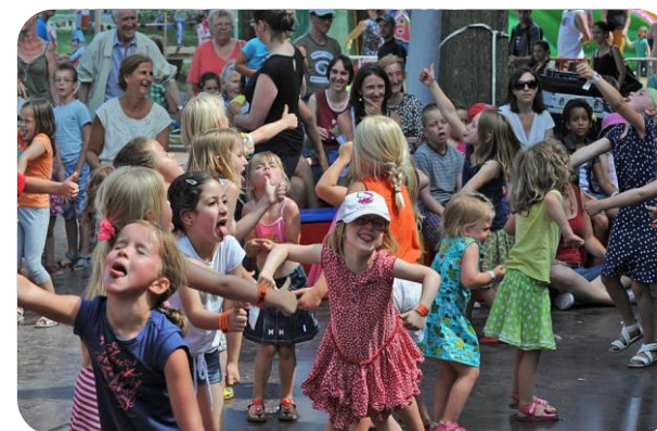
Kindvriendelijke Gentse Feesten