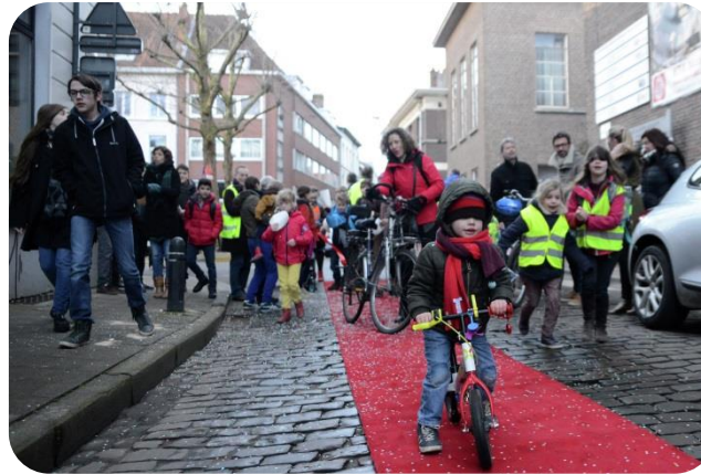
Inzetten op verkeersveiligheid van schoolomgevingen