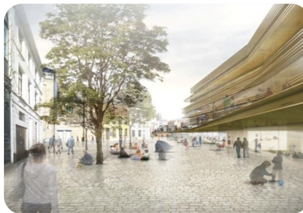
Nieuwe bib aan de Krook