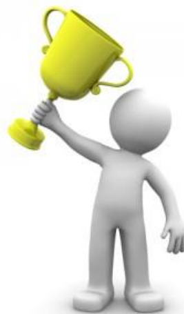
Jong en Wijs prijs