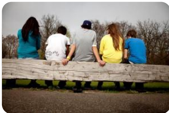
Outreachend werken naar NEET-jongeren (not in employment, education or training)