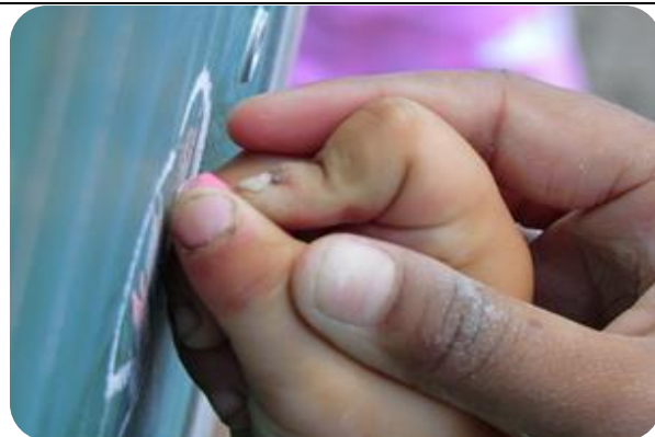
Regie kinderarmoede en armoedebeleid op school