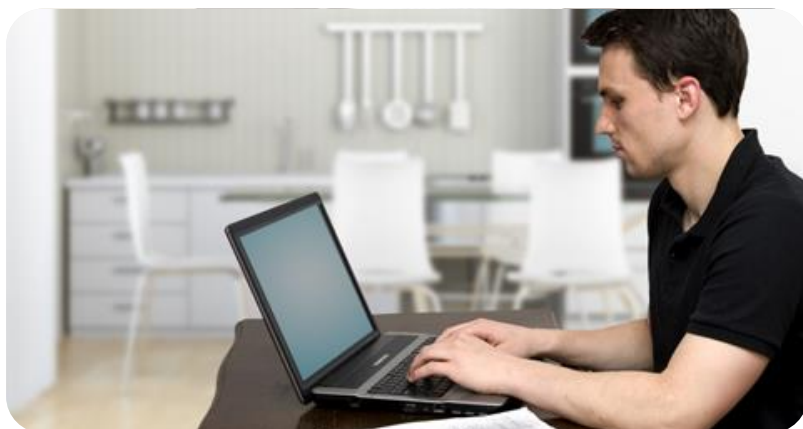
Verder uitbouwen tele- en flexwerken