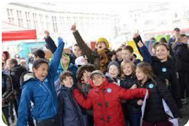
Promoten van de kinderrechten