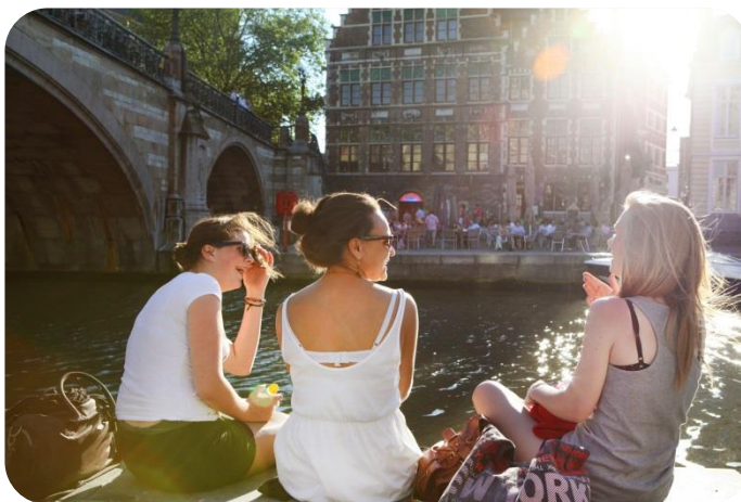
Sfeerbeeld op de Graslei