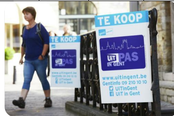
Kansentarium voor vrije tijd voor kinderen en jongeren in armoede