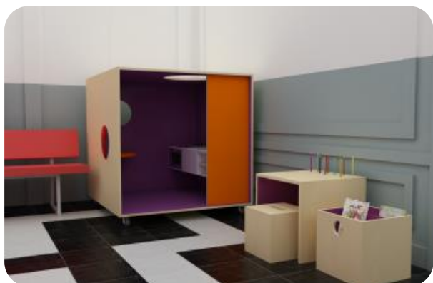
Ontwerp van kinderhoekje balie Wondelgem