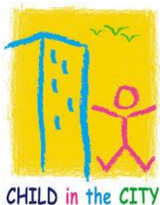
Child in the City Congres in Gent in 2016