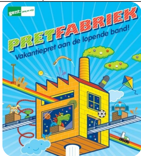
Uitbreiding van vakantieaanbod: de pretfabriek