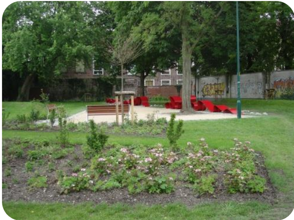
Meer parken en bijkomend woongroen