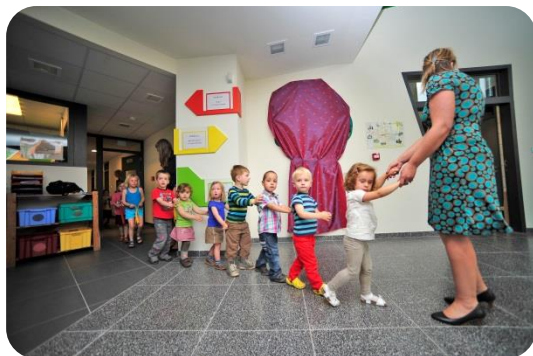
Opening STIBO 't Groen Drieske