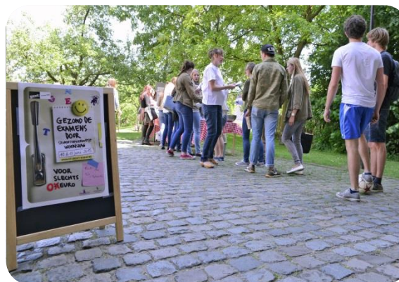
studentenvieruurtje Sint-Pieters abdij