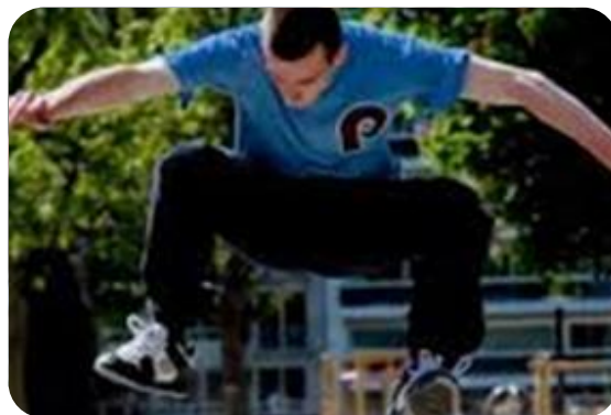
Skatepark op de Blaarmeersen