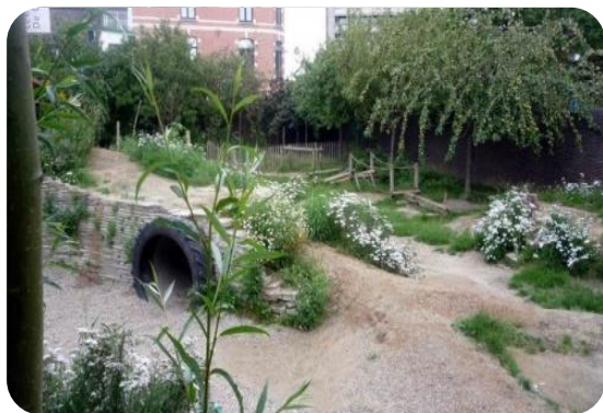
Realiseren van GRAS (BS De Oogappel)