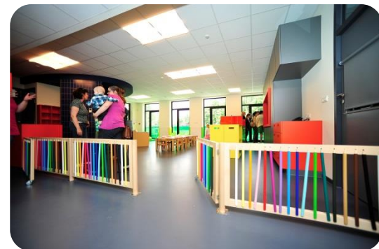
kinderdagverblijf de Droomboom