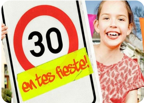
Uitbreiding zone 30 en verdubbeling voetgangersgebied