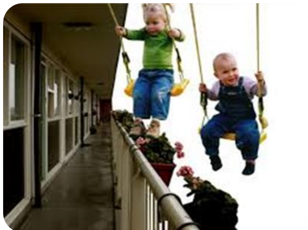
Stimuleren gezinsvriendelijke woningen

contacteren van aannemers en het vergelijken van offertes, opvolging van de werken, ...), het verlenen van energiepremies en energieleningen.