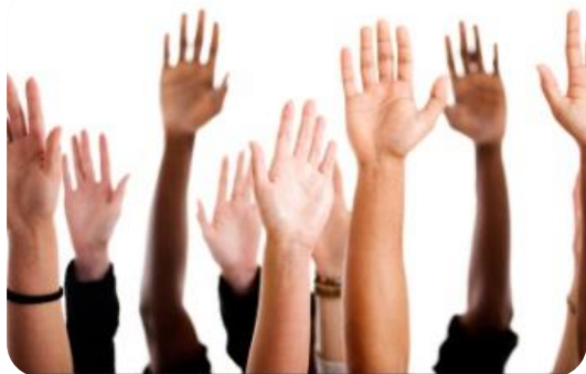
J 1000: een grootschalig inspraaktraject