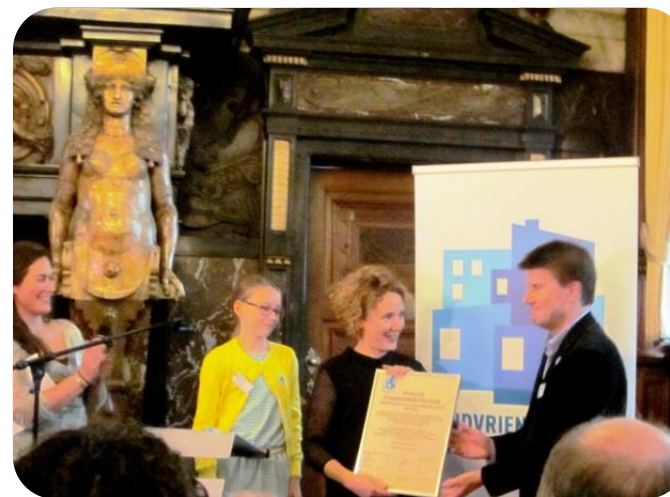
In oktober 2014 kreeg Gent het label 'kindvriendelijke stad'

Sluiten de voorzieningen aan bij de verwachtingen en leefwereld van alle kinderen en jongeren? Wordt er geluisterd naar de stem van kinderen en jongeren? Worden ze gestimuleerd om zelf ook bij te dragen?