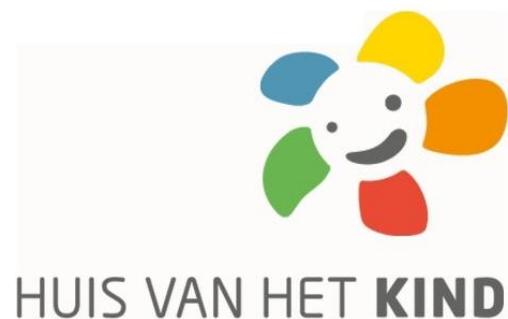
Opstarten van Huizen van het Kind