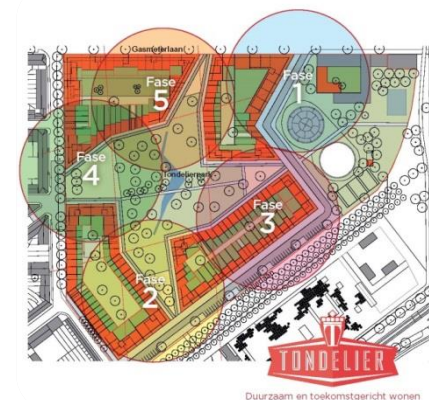
Buursporthal aan de Tondelier