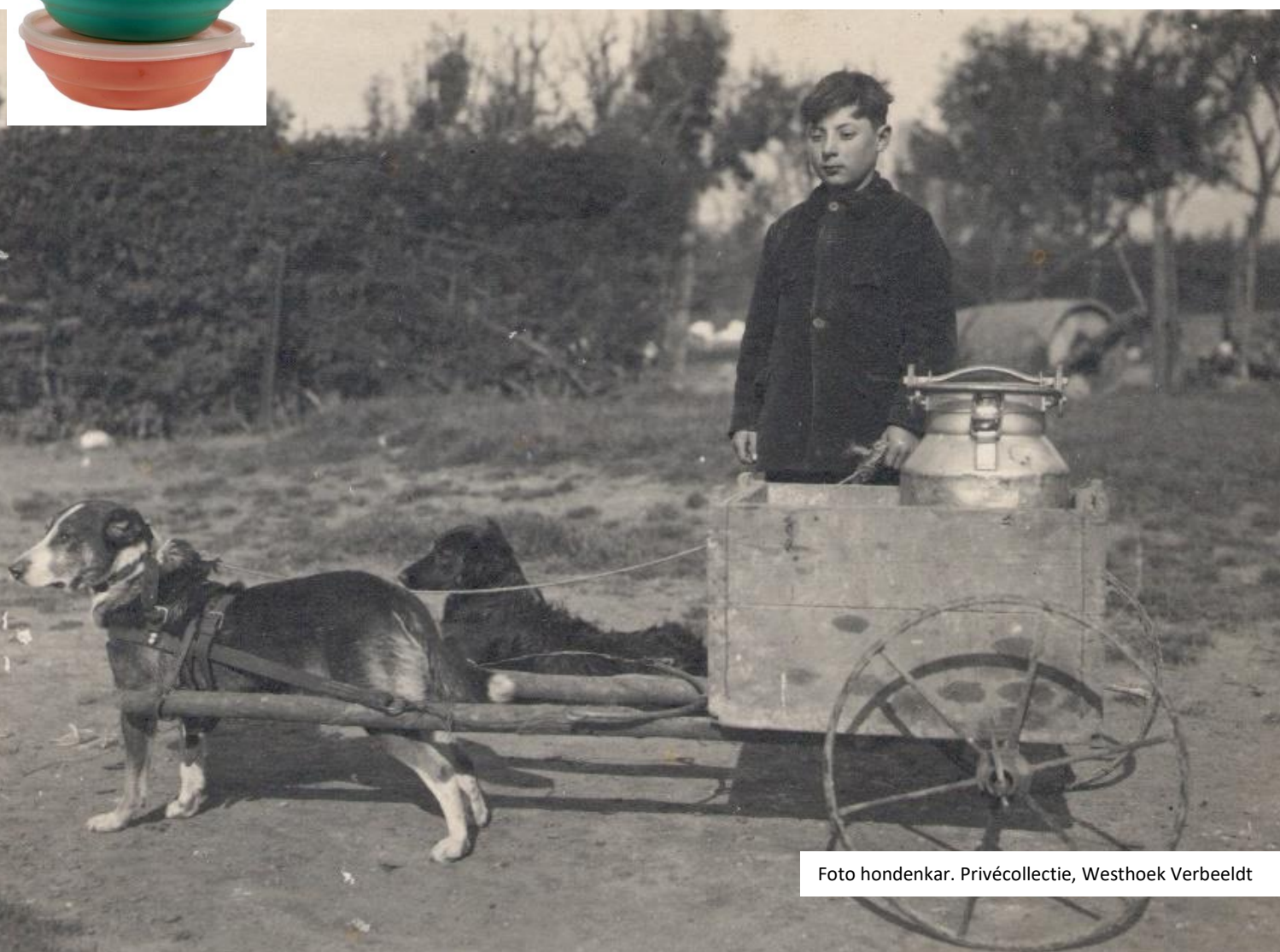
Foto hondenkar.