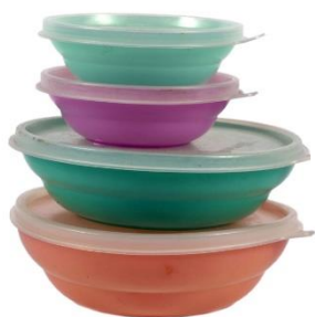
Tupperware potjes.

historica en journaliste bij De Standaard