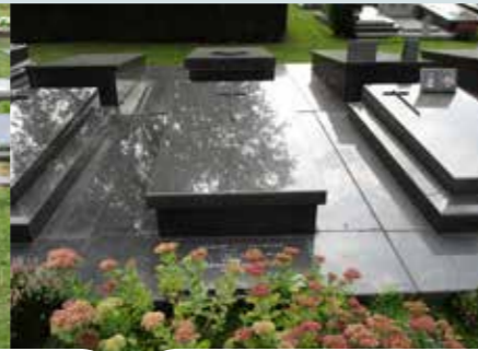
Lichaam of urne bewaren in een grafkelder