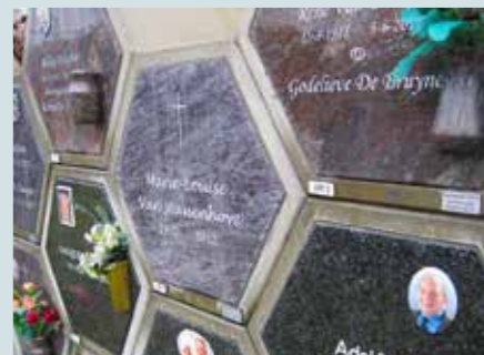
Urne bewaren in een urnenmuur