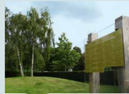
As uitstrooien op een strooiweide