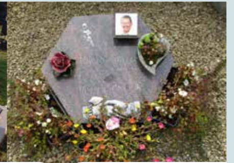
Urne bewaren in een urnenkelder