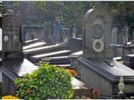
Lichaam of urne bewaren in een historisch waardevol grafmonument