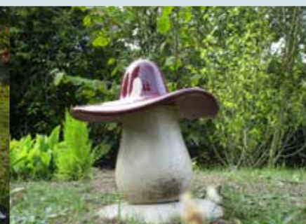
As bewaren in een keramische sierurne voor kinderen (alleen voor kinderen en jongeren)