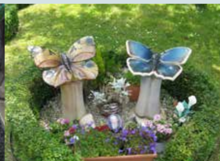
As bewaren in een keramische sierurne in een urnentuin