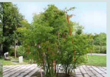
Lint ophangen in de herdenkingsboom voor sterrenkindjes