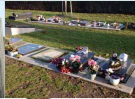
Urne begraven in een urnenveld