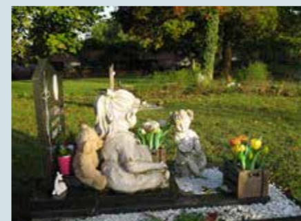
Lichaam of urne begraven in een grondgraf op een kinderperk (kinderen jonger dan 7 jaar en sterrenkindjes)