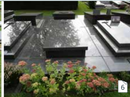
Lichaam of urne bewaren in een grafkelder