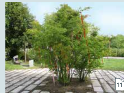
Lint ophangen in de herdenkingsboom voor sterrenkindjes