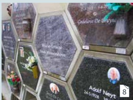
Urne bewaren in een urnenmuur