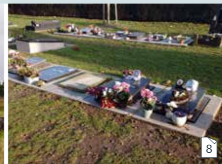
Urne begraven in een urnenveld of urnenkelder