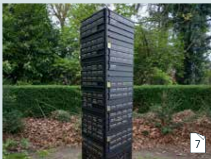
As uitstrooien op een strooiweide