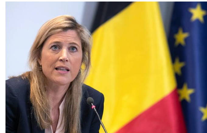
Annelies Verlinden (CD&V), federaal minister van Binnenlandse Zaken in de regering De Croo.

Een 'kindtoets' - een tool waar momenteel hard aan gesleuteld wordt - moet de 'toegenomen spanningen en wantrouwen' tussen politie en jeugd verhelpen. Dat heeft minister van Binnenlandse Zaken Annelies Verlinden (CD&V) aangekondigd.