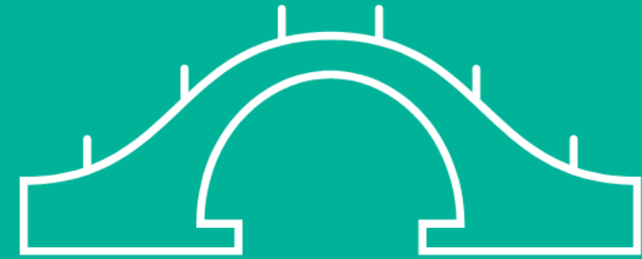
Actoren met brugfunctie naar of vertrouwensfunctie met jongeren