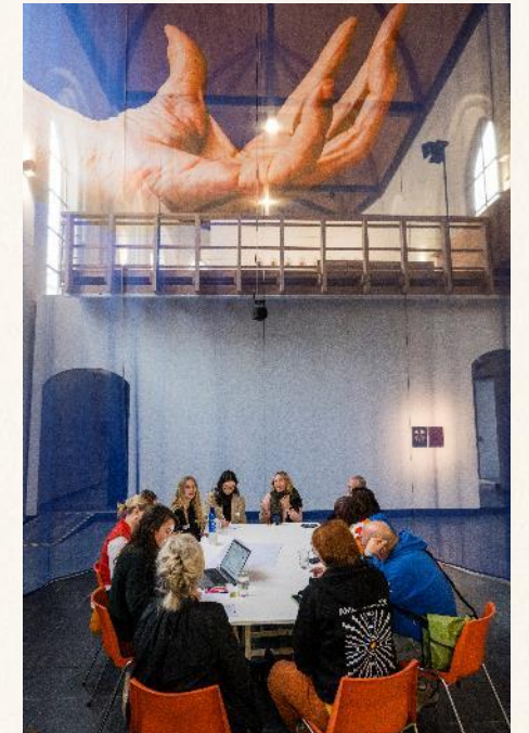
A November 2024, Award Ceremony European Youth Capital 2027, Minard