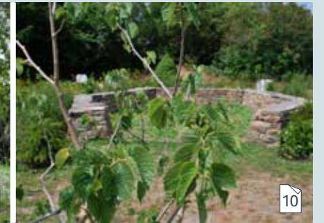
Een plekje op een sterretjesweide