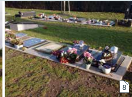
Urne begraven in een urnenveld of urnenkelder