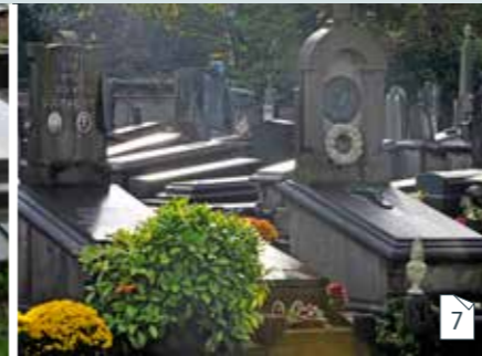
Lichaam of urne bewaren in een historisch waardevol grafmonument