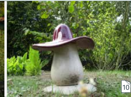
As bewaren in een keramische sierurne voor kinderen (alleen voor kinderen en jongeren)