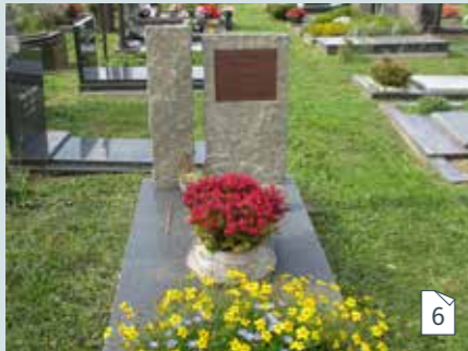
Lichaam of urne begraven in een grondgraf