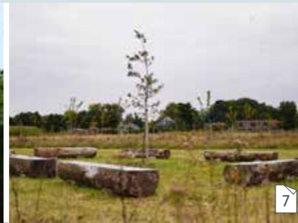
Een plekje op de natuurbegraafplaats