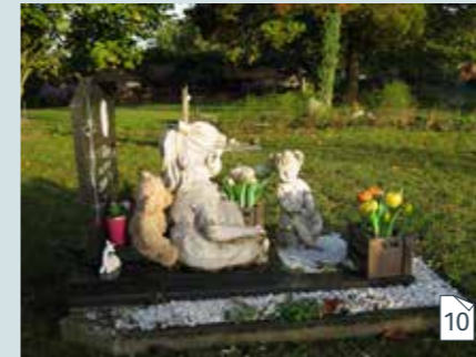
Lichaam of urne begraven in een grondgraf op een kinderperk