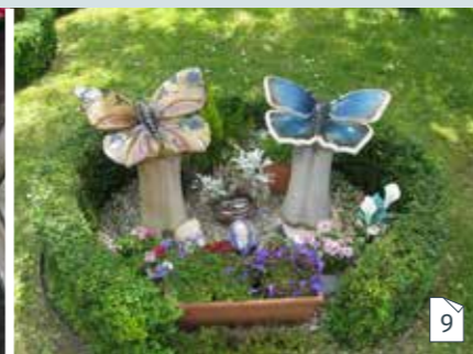
As bewaren in een keramische sierurne in een urnentuin