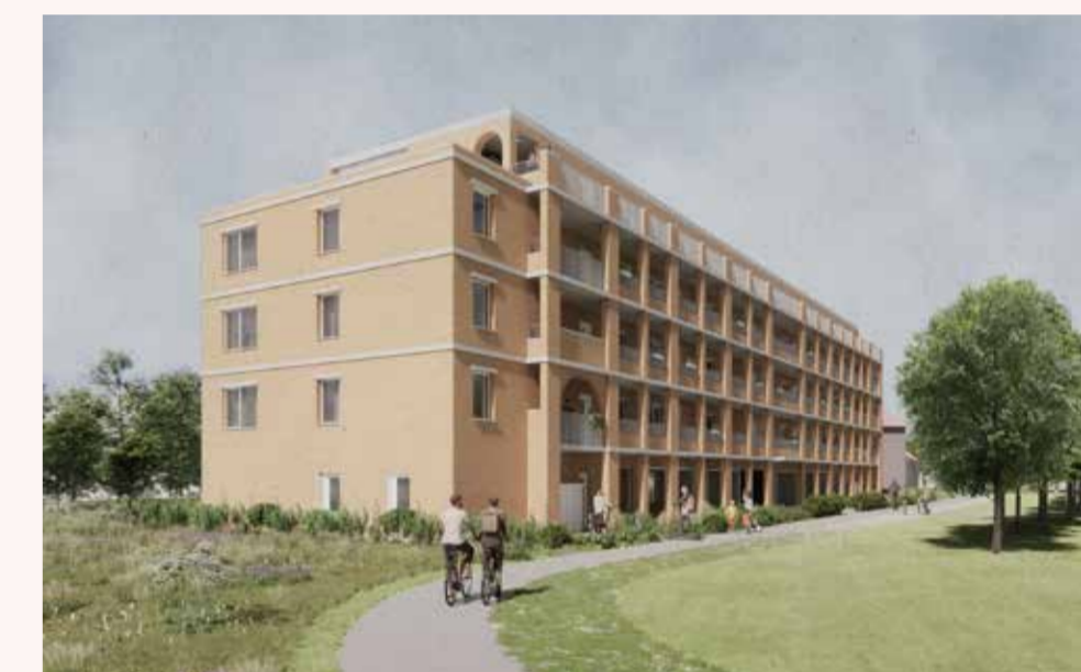
36 nieuwe appartementen in de Agaatstraat

Het stadsontwikkelingsbedrijf sogent bouwt deze nieuwe woningen. Daarna zal sogent ze verkopen aan een woonmaatschappij die ze sociaal zal verhuren.