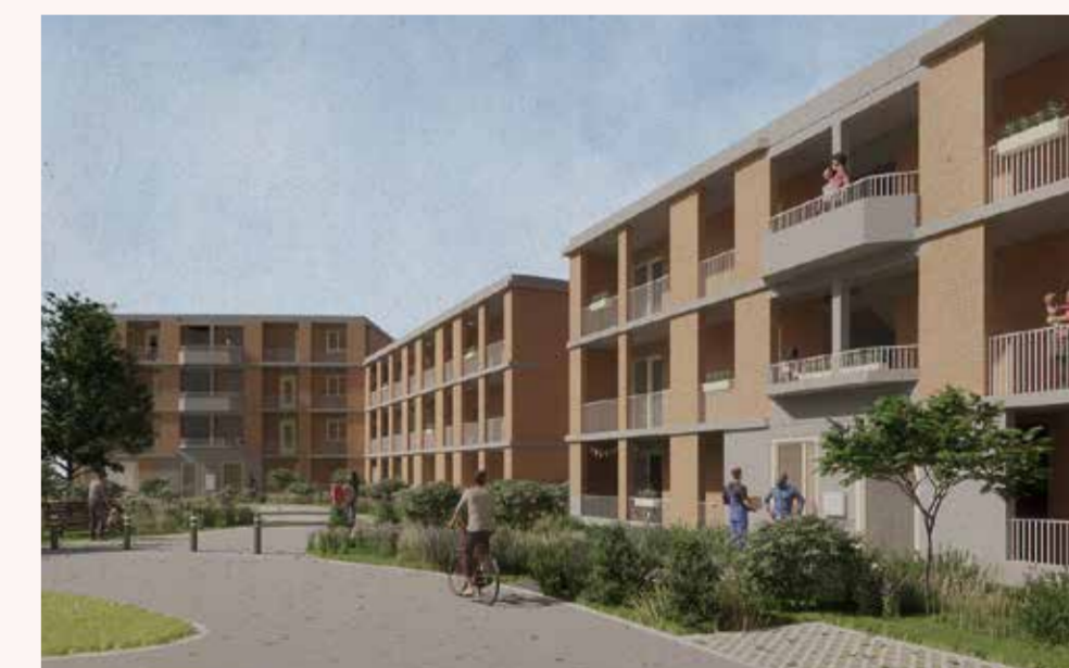
23 nieuwe appartementen in de Berkhoutseide