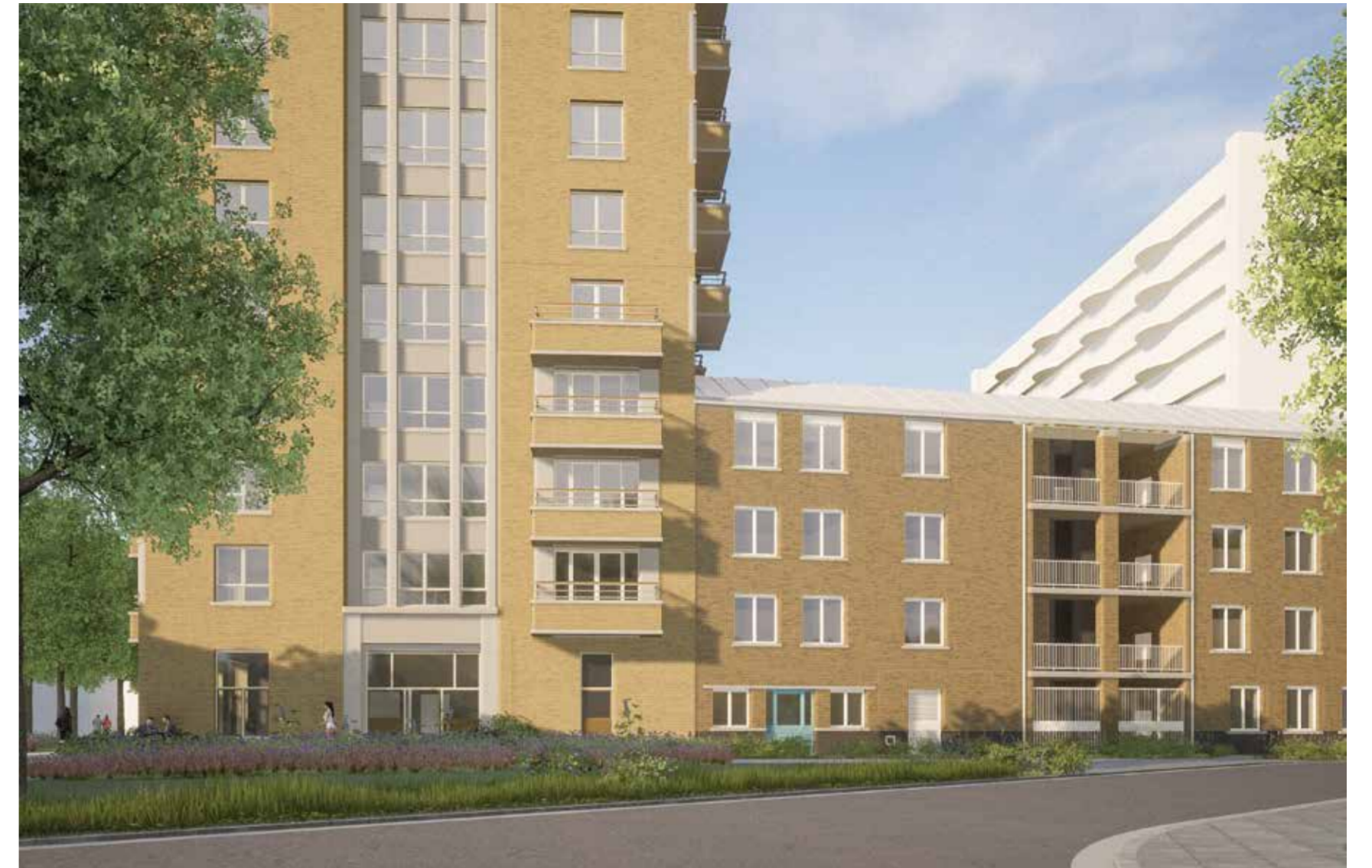
De afbeeldingen op deze pagina zijn simulatiebeelden van het nieuwe appartementsgebouw.

11 In de Agaatstraat start deze zomer de bouw van 36 appartementen.