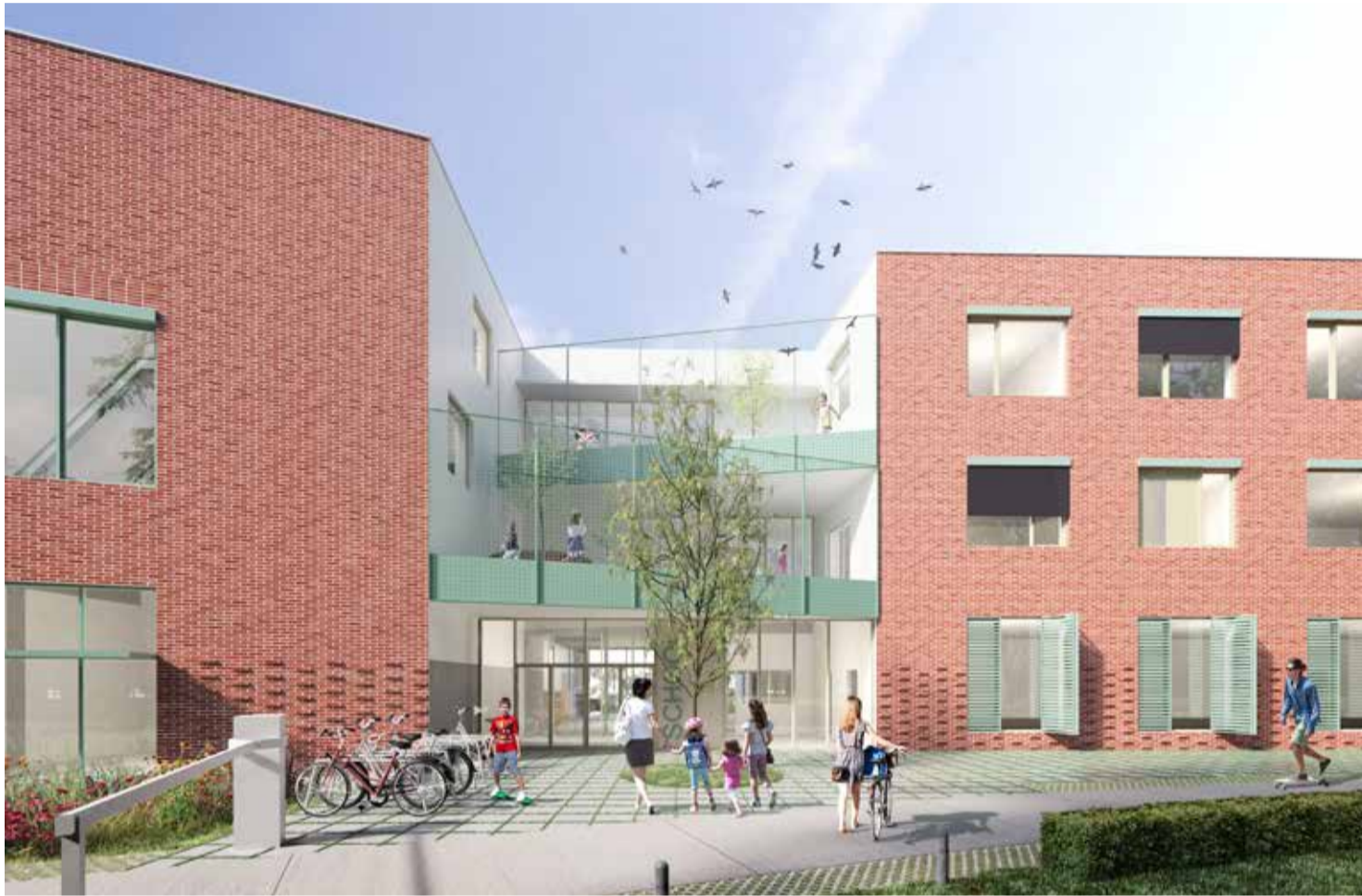
Dit is een simulatiebeeld van het nieuwe schoolgebouw.

Het stedelijke internaat voor kleuter- en lager onderwijs heeft vandaag al een vestiging op het Henri Storyplein, maar de afdeling van de Brugse Poort verhuist naar het nieuwe gebouw op het Storyplein. Daar zal er plaats zijn voor 56 kinderen.