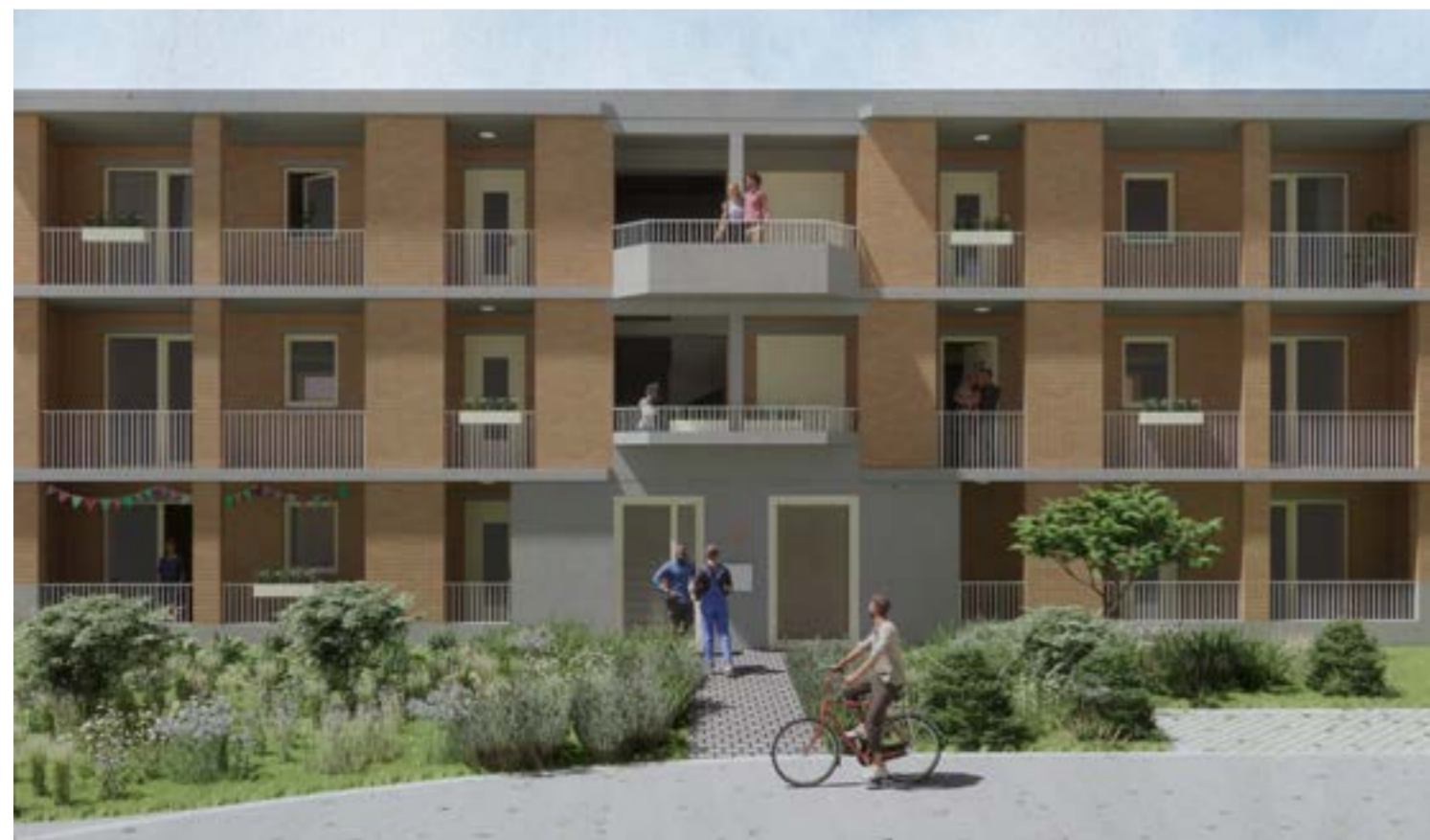
Deze simulaties geven een idee van hoe de nieuwe sociale woningen er in de Berkhoutsheide zullen uitzien.