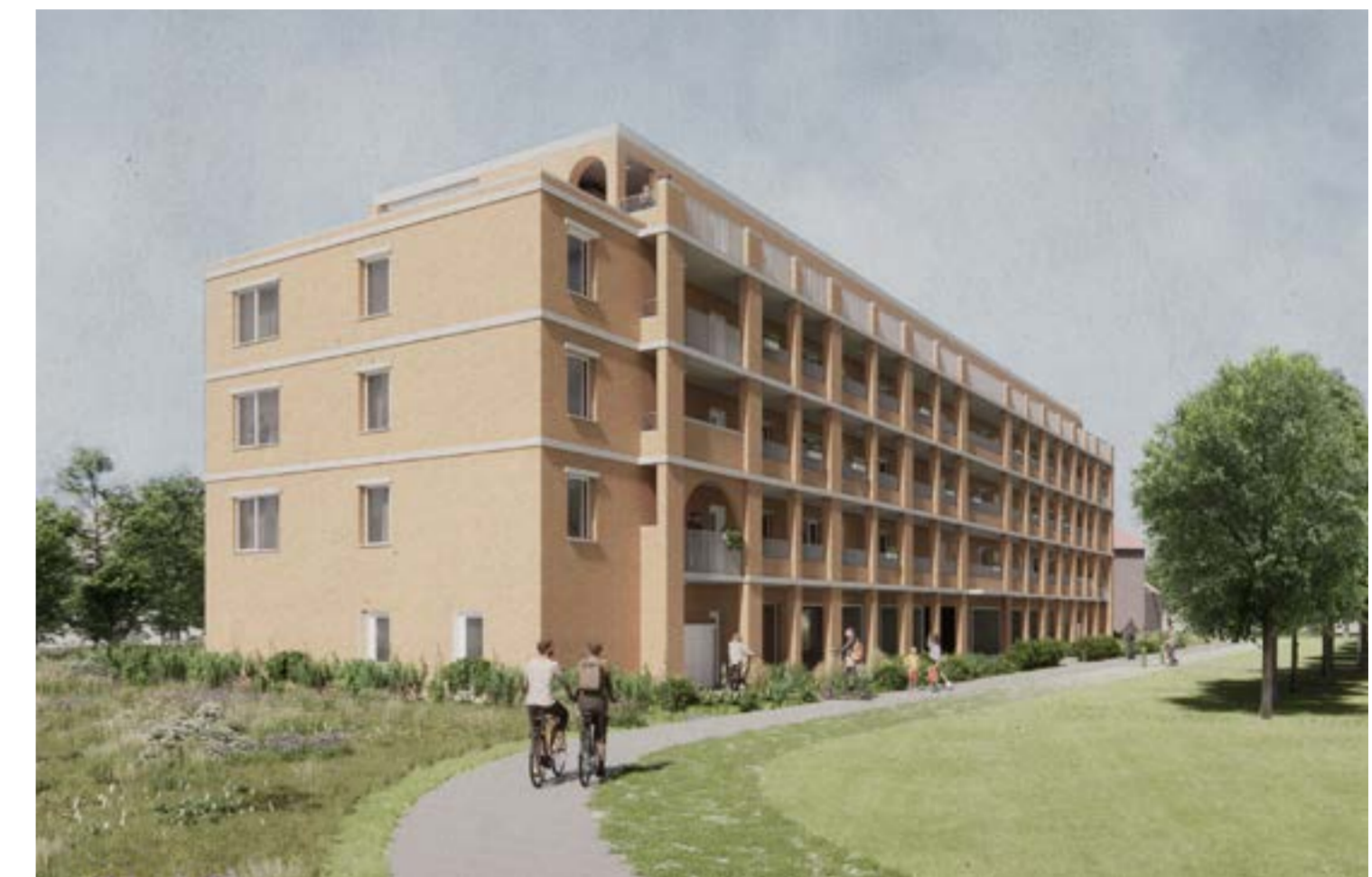
Deze simulaties geven een idee van hoe de nieuwe sociale woningen er in de Agaatstraat zullen uitzien.