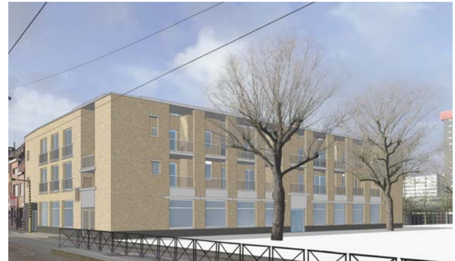
Deze simulatie geeft een idee van hoe het nieuwe gebouw op het Rerum Novarumplein er zal uitzien.

De bouw van het wijkrestaurant en sociale woningen op het Rerum Novarumplein is begonnen. Op de eerste en de tweede verdieping van het gebouw richt Thuispunt Gent in totaal 16 sociale appartementen met één slaapkamer en een terras in. De bouwwerken duren tot half 2025.