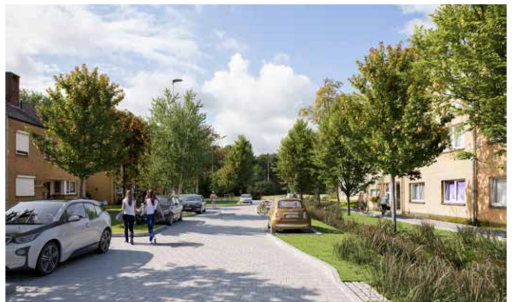
De Smaragdstraat en Berkhoutsheide krijgen een inrichting als woonerf.

Ga naar de website : www.stad.gent/wegenwerken (zoekterm: Kikvorsstraat)