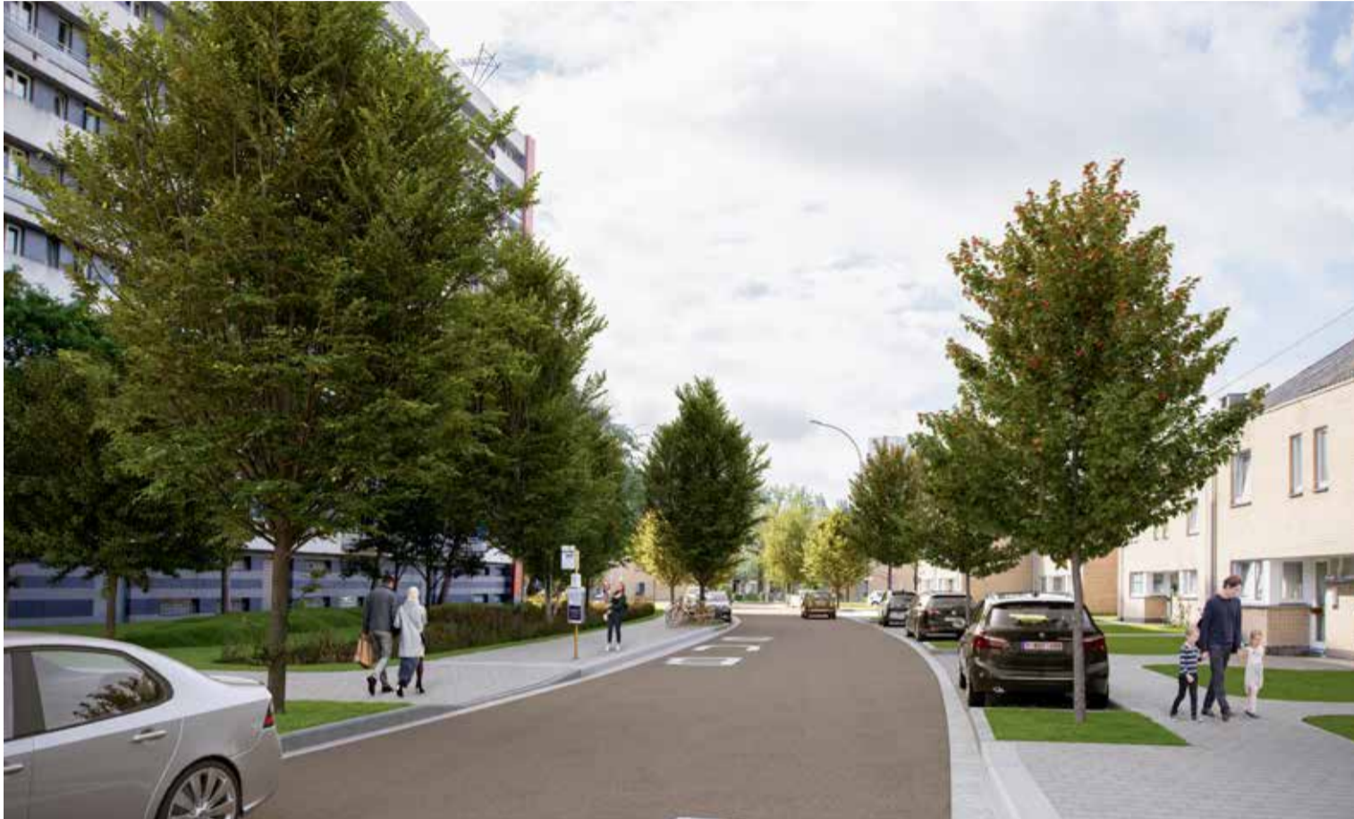
De Kikvorsstraat wordt smaller, zo is er plaats voor een ruime bushalte, brede voetpaden en bomen in de parkeerstroken.

Om het nieuwe appartementsgebouw dat op de plaats van de woontoren Saturnus komt te kunnen bouwen, moet de bocht van de Kikvorsstraat en de Edelsteenstraat verlegd worden. Ook Berkhoutsheide, de Smaragdstraat en de parking aan woontoren Windekind krijgen een nieuwe inrichting. De werken beginnen vanaf september 2022. De omwonenden krijgen een brief met de gedetailleerde planning.