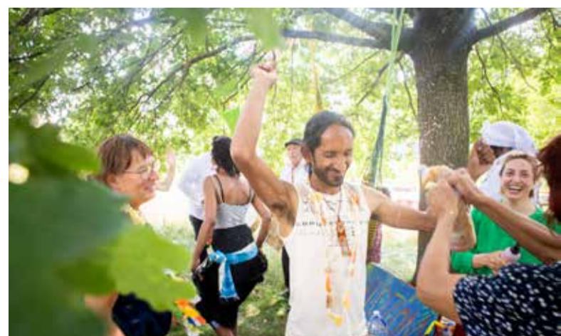
Midzomerfeest in juni

In de cultuurcontainers vind je ook Larf met filmavonden, Mais Quelle Chanson en Deeltijds Kunstonderwijs.