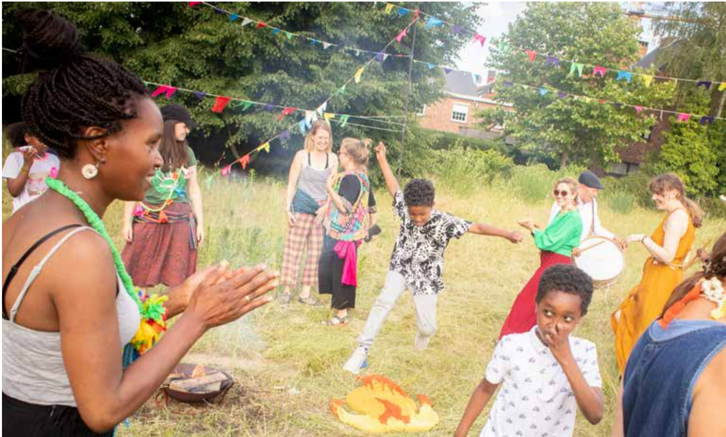
Midzomerfeest in juni – © foto's Tim Theo Deceuninck

Misschien was je op het midzomerfeest. Of misschien zag je de witte borden met de vraag 'Hoe ga jij me missen?'. Het zijn allemaal acties van de kunstorganisatie Manoeuvre. De organisatie maakt samen met mensen kunst, in Nieuw Gent, maar ook onder meer in Oostende en Ronse.