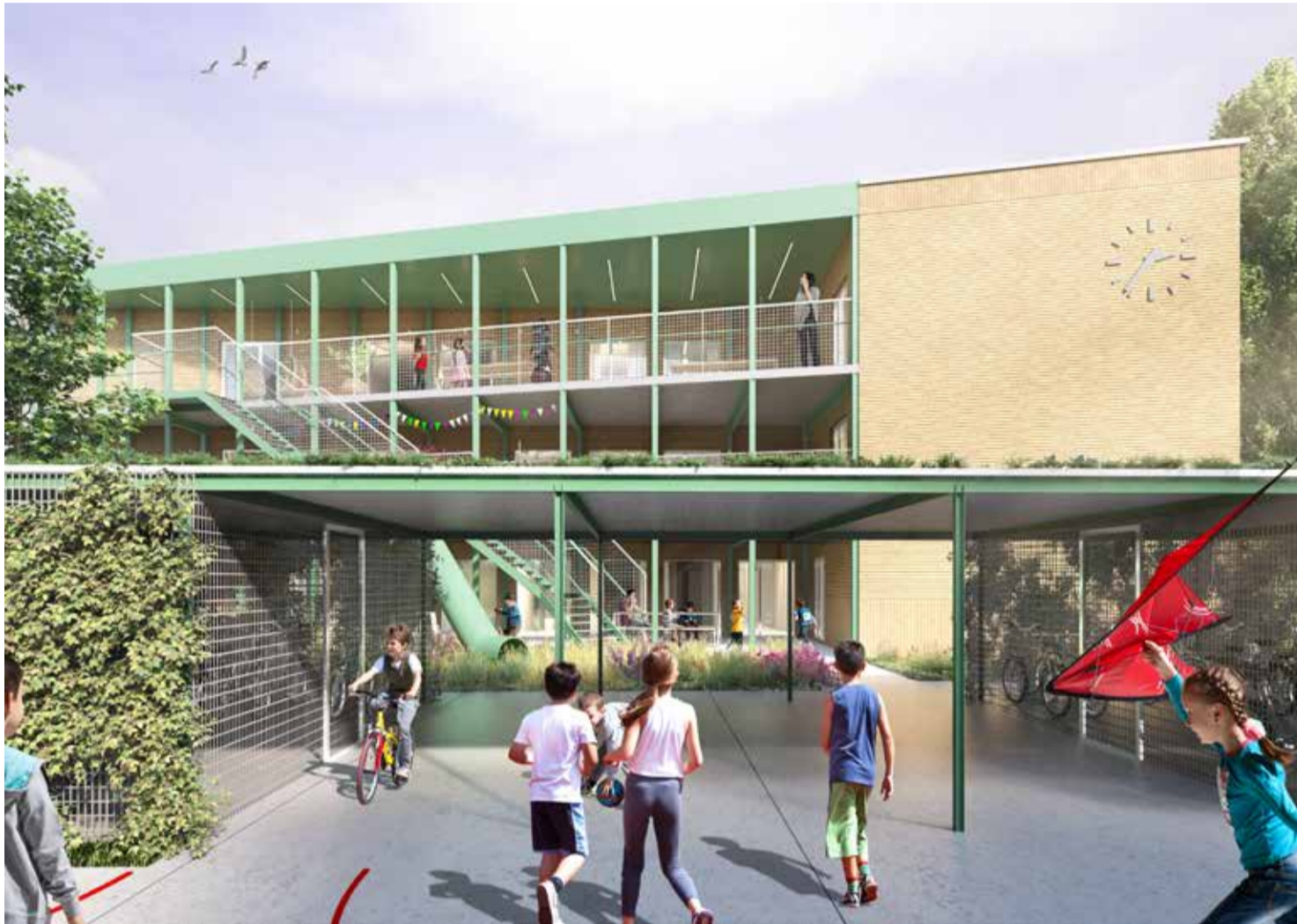
De kinderen van het internaat zullen van veel buitenruimte kunnen genieten.

De plannen voor het nieuwe schoolgebouw en de uitbreiding van het internaat op het Henri Storyplein zijn klaar. Er gaat veel aandacht naar de kinderen en het klimaat. De bouw start in 2023 en moet in 2025 afgerond zijn.