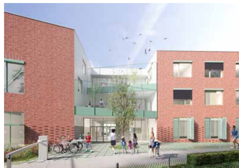
Het schoolgebouw bestaat uit een publiek en een gesloten deel.

Als alles goed gaat, beginnen de werken in 2023 en worden de gebouwen in gebruik genomen in 2025. Voor ongeveer ¾ van de bouwkost kan de Stad rekenen op subsidies van Agion, het Vlaams agentschap voor infrastructuur in het onderwijs.