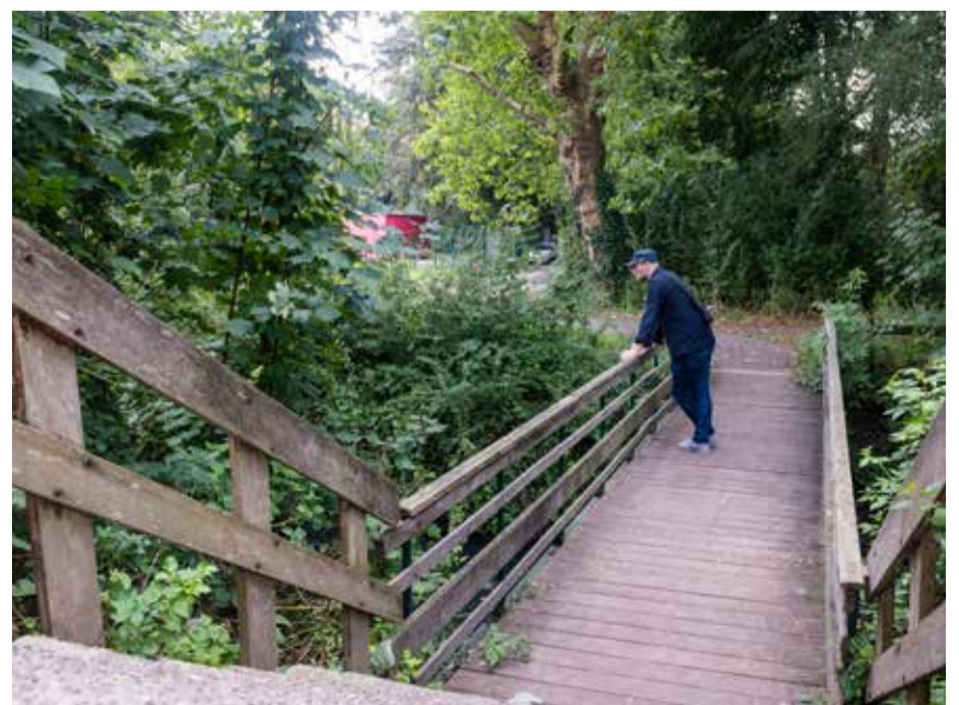
Het oude brugje met trappen wordt vervangen door een bredere brug met een zachte helling.

Eind september zal je de brug al kunnen gebruiken. Eind oktober is de brug dan volledig klaar.