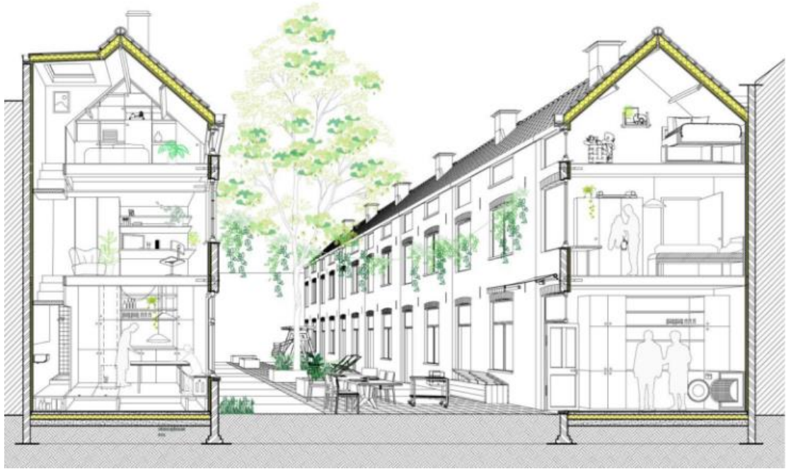
Toekomstscenario, (Origin, ism Polo Labs en Daidalos Peutz)