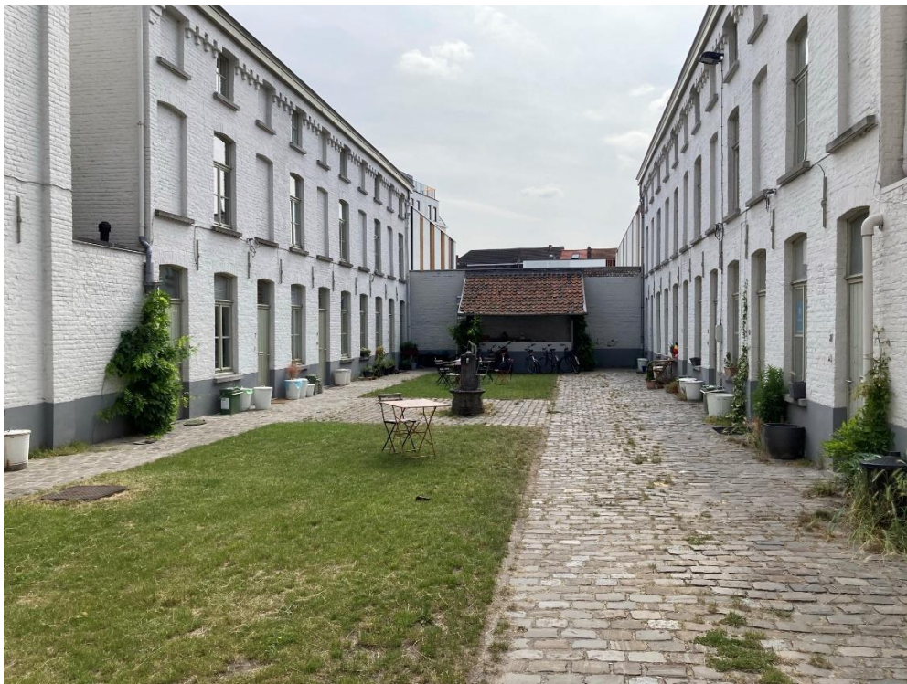
Spitaalpoortstraat Gent, nu (Origin, ism Polo Labs en Daidalos Peutz)