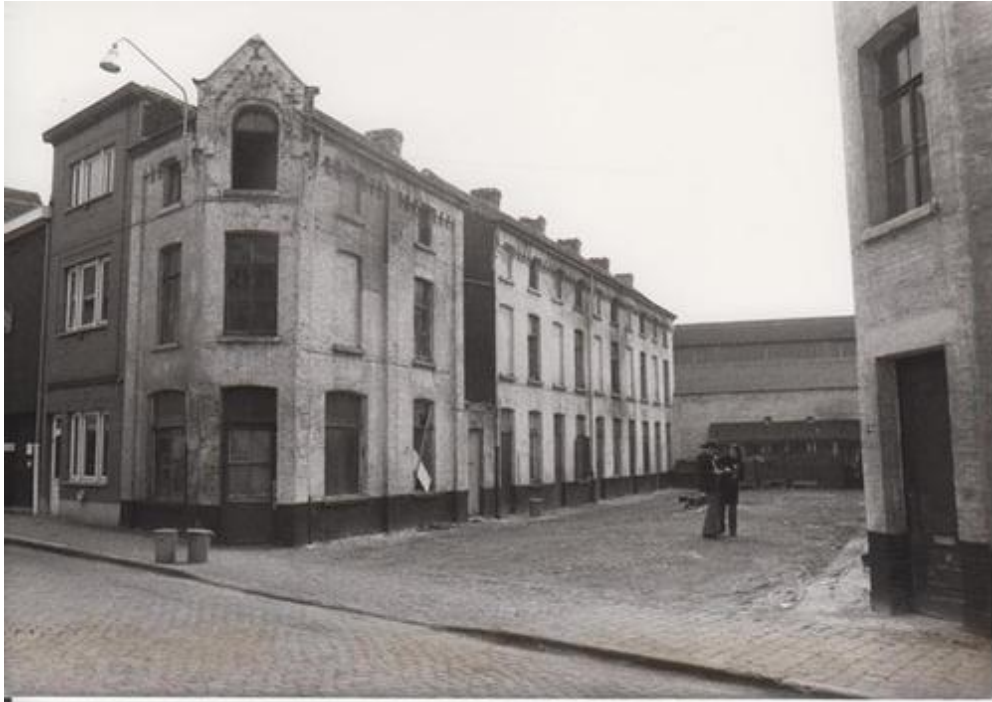
Spitaalpoortstraat Gent, toen (Origin, ism Polo Labs en Daidalos Peutz)