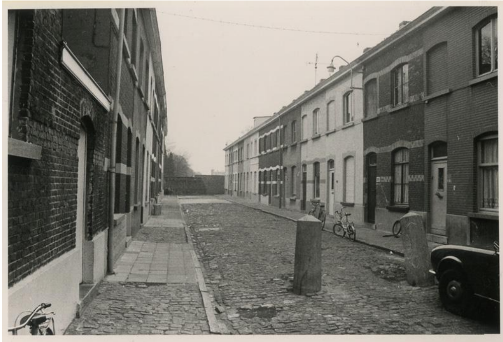
Palinghuizen Gent, toen (Origin, ism Polo Labs en Daidalos Peutz)