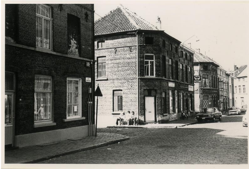
Wasstraat Gent, toen (Origin, ism Polo Labs en Daidalos Peutz)