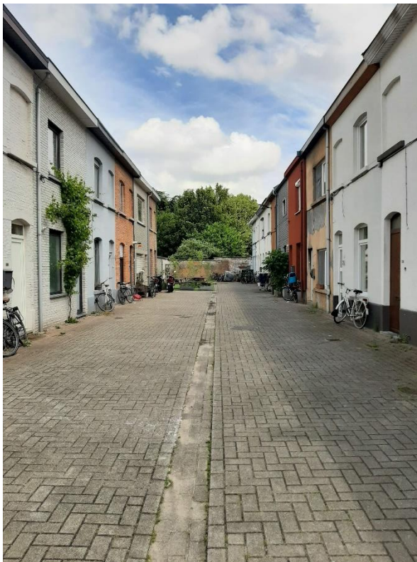
Palinghuizen Gent, nu (Origin, ism Polo Labs en Daidalos Peutz)