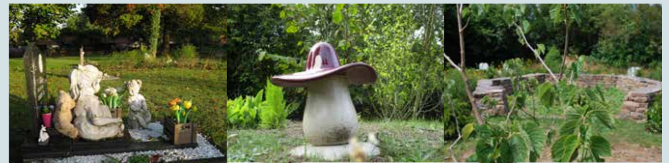
Lichaam of urne begraven in een grondgraf op een kinderperk