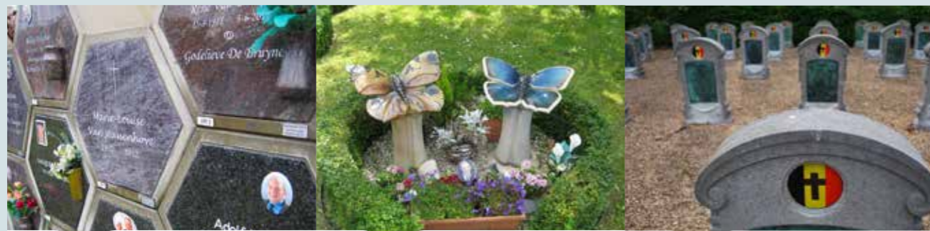
Urne bewaren in een urnenmuur