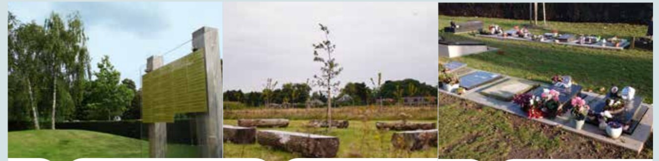
As uitstrooien op een strooiweide