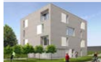
G. Groepswonen Bowaaters New Orleansstraat 9000 Gent