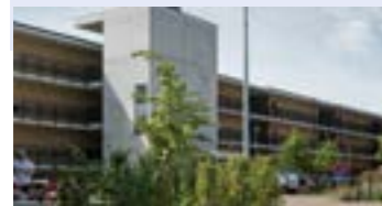
G. Groepswonen Bowaaters New Orleansstraat 9000 Gent