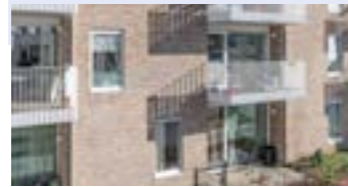
E. Sociale assistentiewoningen Botermarktpoort Jozef Vervaenestraat 9050 Ledeborg