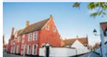
D. Assistentiewoningen De Zonnetuin Hutsepotstraat 9052 Zwijnaarde