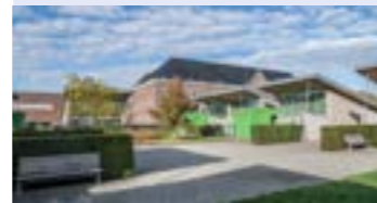
F. Sociale assistentiewoningen Residentie Zonnwind Zuidbroek 9030 Mariakerke