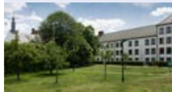
E. Sociale assistentiewoningen Botermarktpoort Jozef Vervaenestraat 9050 Ledeborg