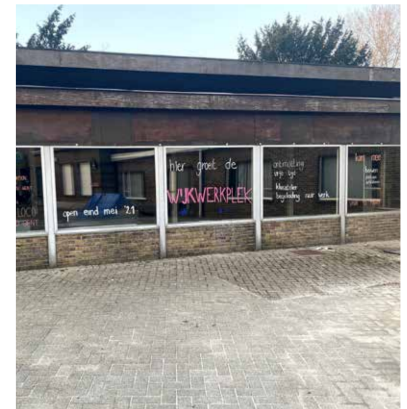
De voormalige Kring maakt plaats voor de wijkwerkplaats.

Het wordt ook de uitvalsbasis van de buurtpartners aanloophuis Poco Loco, KAA Gent Foundation, Samenlevingsopbouw, Campus Atelier en de Zuidpoort. De opening is gepland eind mei 2021, maar je kan nu al mee bouwen, poetsen of schilderen.