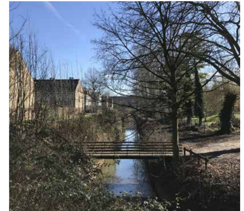
De huidige brug over de Leebeek.

Wat verderop, in het verlengde van de Smaragdstraat, komt er nog een brug over de Leebeek. Die brug zal er zowel voor auto's als fietsers en voetgangers zijn. De private ontwikkelaar van het woonproject in de Oudenaardsesteenweg zal de brug bouwen.