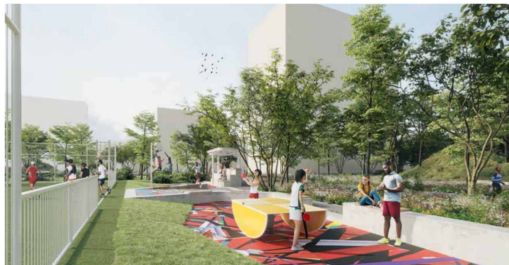
Dit beeld geeft een idee van de nieuwe tribune, de basketbalring en de pingpongtafel naast het sportveld.