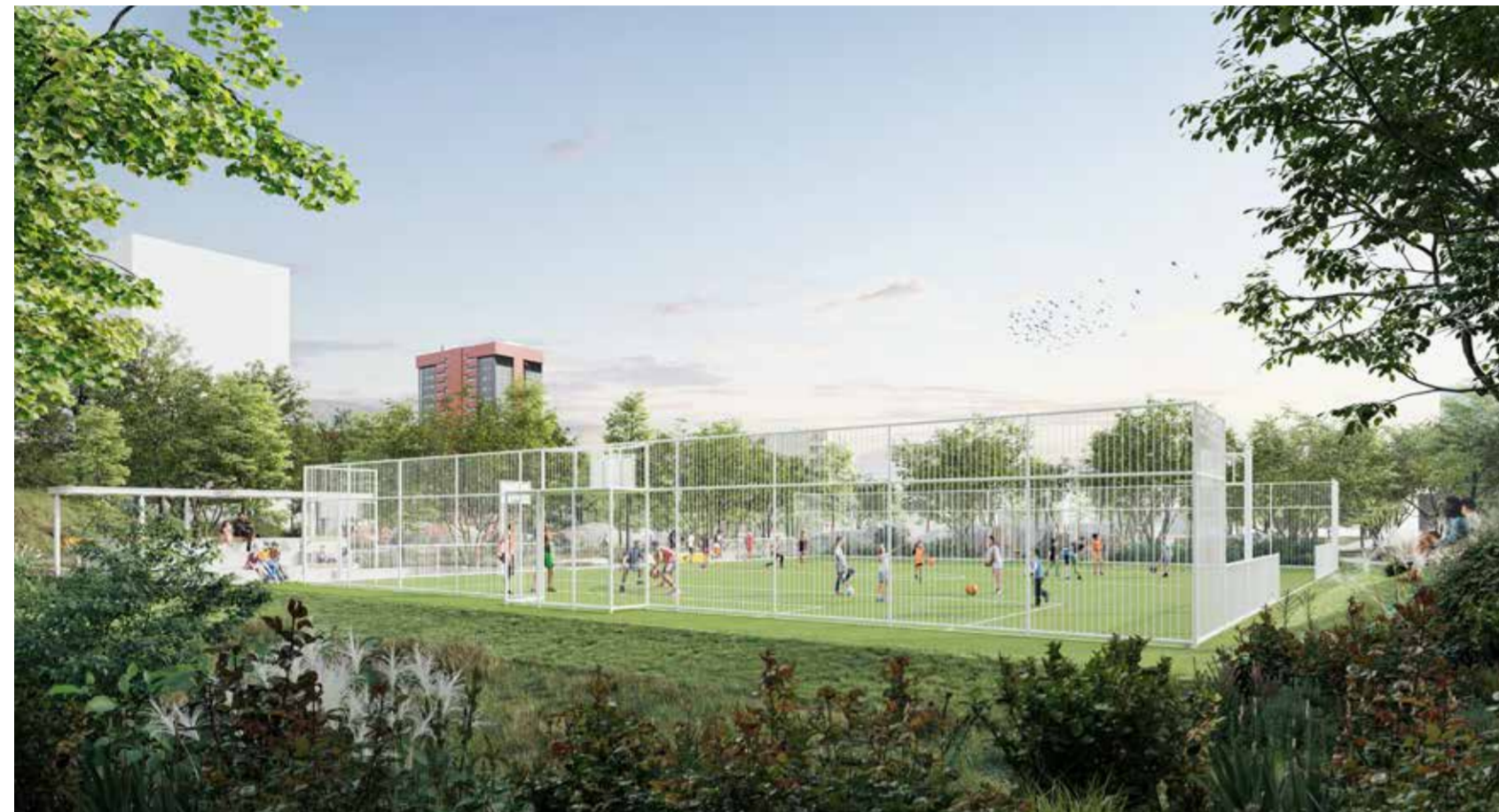
Dit beeld geeft een idee van het nieuwe sportveld in kunstgras waar je zal kunnen voetballen en basketballen.

Na suggesties tijdens de expo over het voorontwerp van het park afgelopen najaar zijn er nog verschillende zaken aangepast. Rond het polyvalente sportveld in kunstgras komen nog een (gedeeltelijke) omheining, een pingpongtafel en een basketbalring. Samen met de sportkooi aan de Pandaschool, de fitnessstoestellen en twee pannakooien vormt dit een mooi sportaanbod voor de wijk.