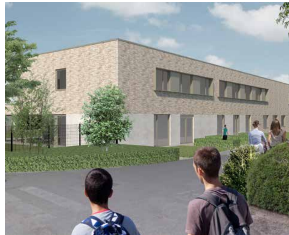
Simulatiebeeld van het nieuwe gebouw naast de paviljoenen.

Het centrum heeft expertise om de jongeren kwaliteitsvolle ondersteuning en onderwijs op maat aan te bieden. Styrka betekent sterk in het Zweeds. Het staat voor aandacht voor talenten en veerkracht van de jongeren en medewerkers in de organisatie. Het centrum wil een plaats zijn waar de jongeren thuis mogen komen. Het is een omgeving waar mensen kansen krijgen om te groeien doorheen het leven.