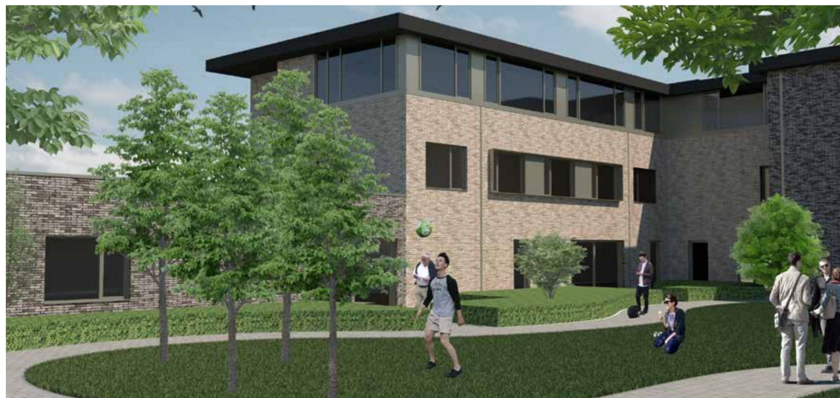
Simulatiebeeld van het nieuwe gebouw langs de Gestichtstraat.