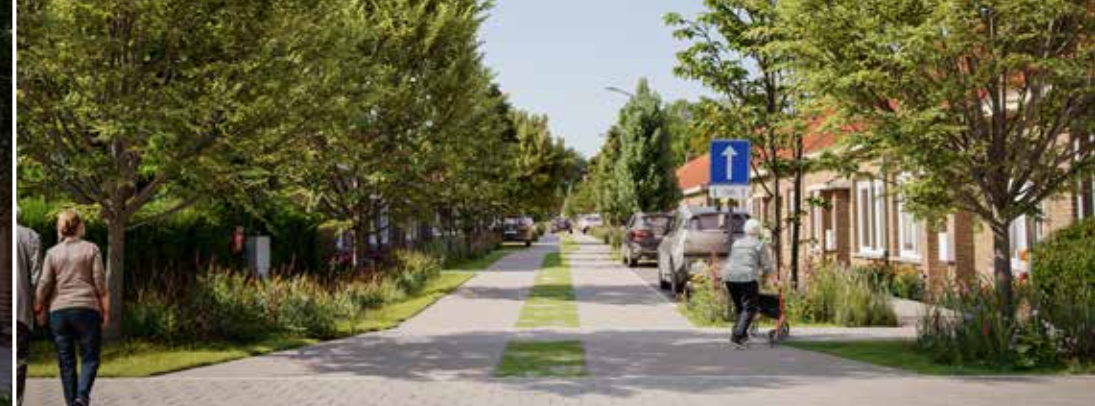
Toekomstbeelden van Tuinwijk de Warande