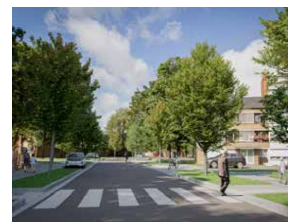
Toekomstbeeld: Voetpaden, oversteekplaatsen en bushaltes worden aangelegd op logische locaties én zonder hinderlijke opstapjes: (Zicht nr. 3 op het plan)

Op termijn zal de volledige Kikvorsstraat aangepakt worden. Die werken volgen de vervanging van de zes woontorens.