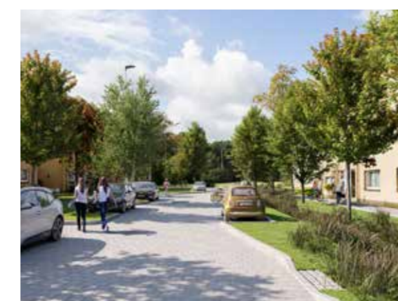
Toekomstbeeld: Berkhoutsheide en de Smaragdstraat worden wooneven. Daar is maximaal plaats voor voetgangers, fietsers en groen: (Zicht nr. 2 op het plan)

In de aanleg gaat heel wat aandacht naar toegankelijkheid. Voetpaden, oversteekplaatsen en bushaltes worden aangelegd op logische locaties én zonder hinderlijke opstapjes. Er komt ook blindengeleiding op de voetpaden.