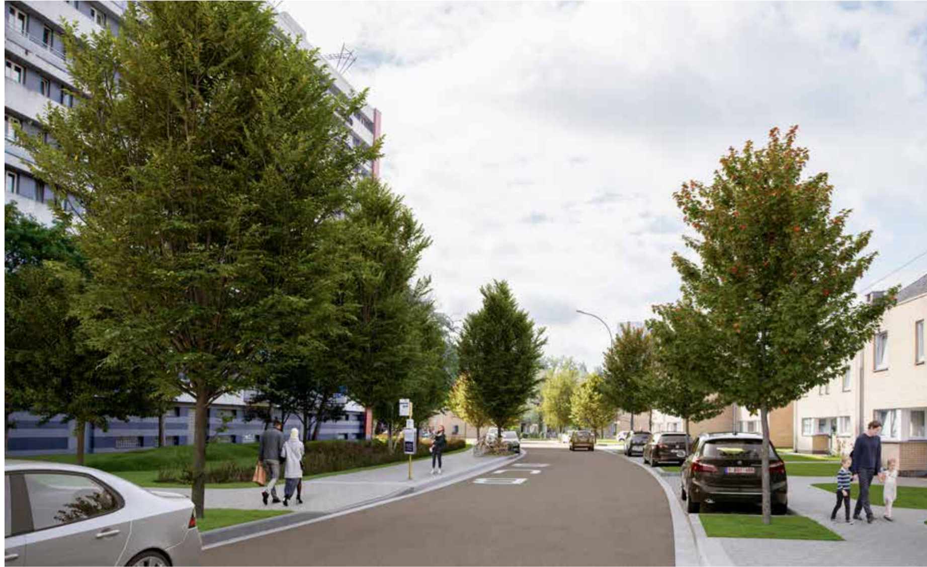
Toekomstbeeld: De Kikvorsstraat wordt smaller en krijgt aan beide kanten parkeerplaatsen en bomen. (Zicht nr. 1 op het plan)